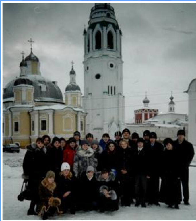
«Лировцы» в Вологде