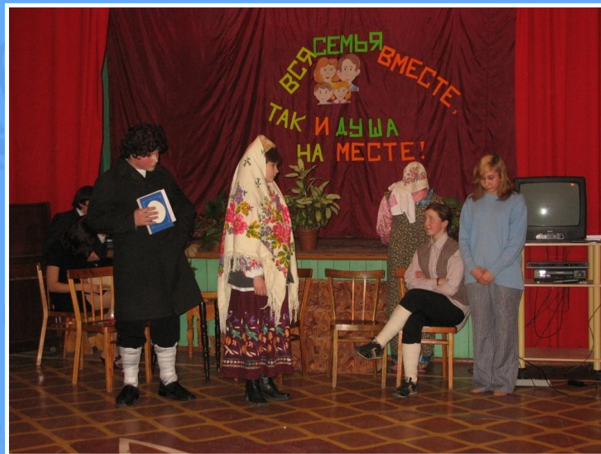
Пробуем на родной сцене (вечер «Вся семья вместе, так и душа на месте»)