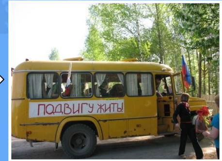
Автопробег, посвященный 65-летию Победы