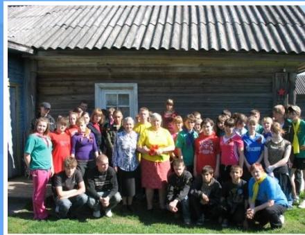
На родине Героя Советского Союза А.А. Карташова