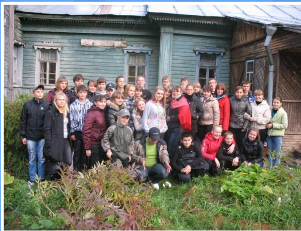
В усадьбе И. Северянина. п. Владимировка