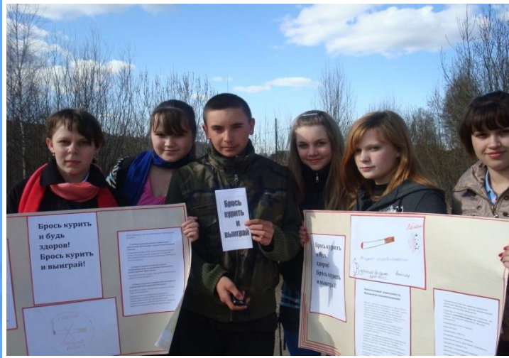
Акция «Брось курить и выиграй».