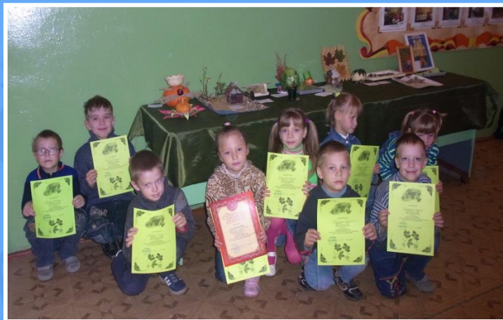
Долгожданные грамоты для первоклассников.