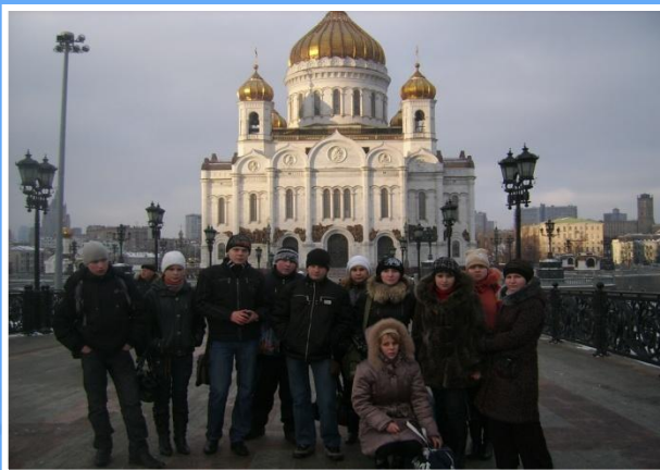
В Москве, у храма Христа-Спасителя.