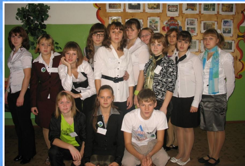
Наш «педагогический коллектив»...