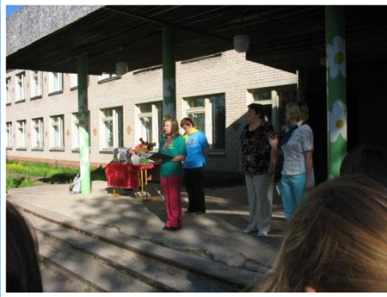
Старт дня - линейка