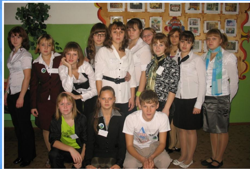
Наш «педагогический коллектив»...