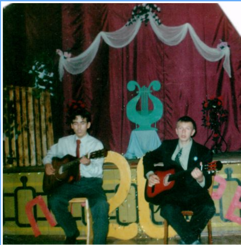
Гитаристы клуба «Ли́ра»

Лировцы! Не зарывайте свои таланты! Дерзайте! (из «лировских» призывов)