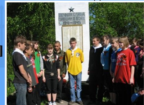
У обелиска павшим