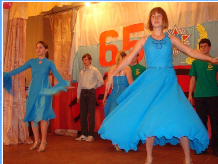
... и танцоры