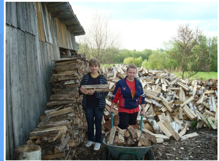
Помощь пожилым людям.