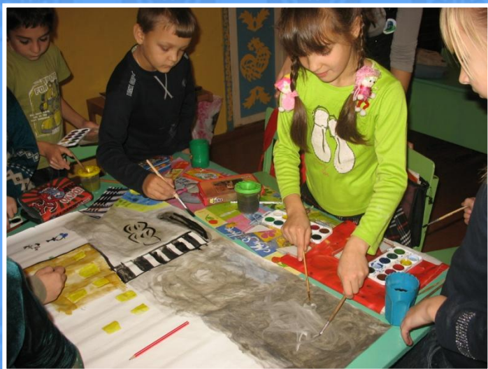
Урок рисования «Мы за чистую планету».