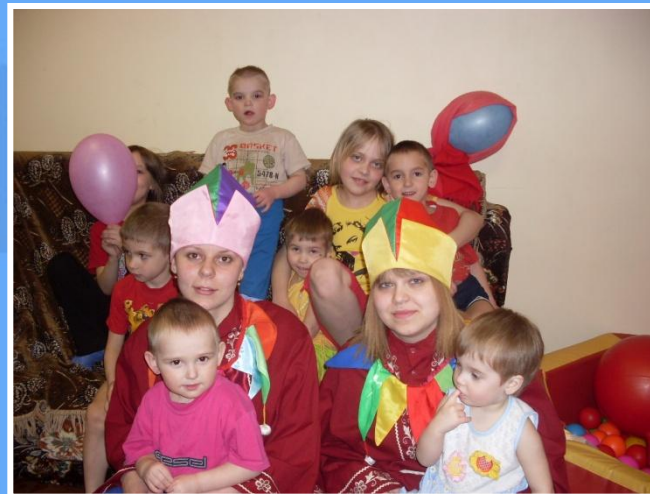
Утренник для детей из неблагополучных семей.