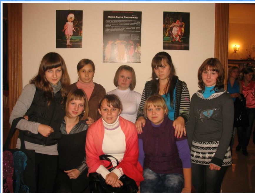
Учимся у других (на спектакле в Камерном театре г.Череповец)