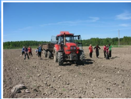
Дело и учит, и мучит, и кормит