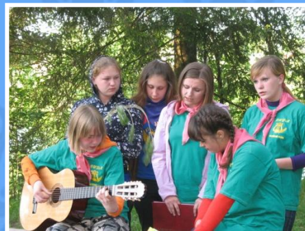
«Я никогда не забуду наших вечеров, костров дружбы, песен под гитару...»