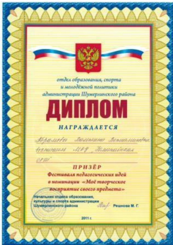
2011г. Диплом призёра фестиваля педагогических идей Шумерлинского района Чувашской Республики