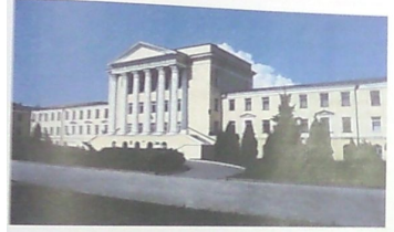
Рис. 1. Фасад главного корпуса ВГАСУ

I. Краткая историческая справка В 1930 году на базе Воронежского индустриального техникума, вошедшего в состав теплотехнического и строительного отделений, был создан Воронежский инженерно-строительный институт. В 1991 г. институт преобразован в Воронежскую государственную архитектурно-строительную академию, а в 2000 г. вуз получил статус Воронежского государственного архитектурно-строительного университета.