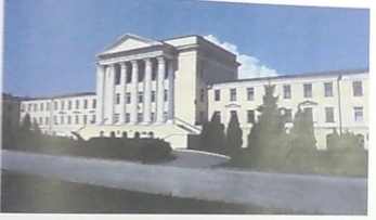
Рис. 1. Фасад главного корпуса ВГАСУ

В 1930 году на базе Воронежского индустриального техникума, в своем составе теплотехническое и строительное отделения, был организован Воронежский инженерно-строительный институт. В 1991 г. институт государственную архитектурно-строительную академию, а в 2000 г. вуз получил статус Воронежского государственного архитектурно-строительного университета.