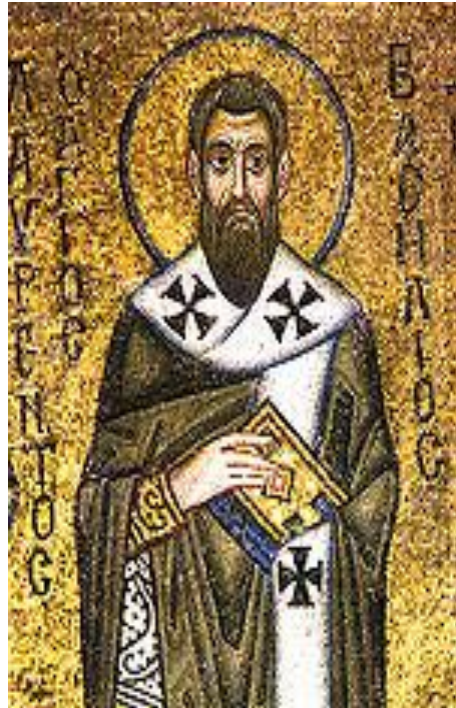
Святитель Василий Великий.