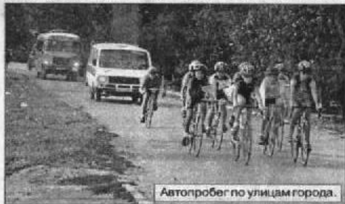
Автопробег по улицам города.

бригады училища подготовили и показали выступления, призывающие к здоровому образу жизни, выразили свой протест употреблению наркотиков, алкоголя и табакокурению. В ответ участники автопробега услышали мнения местной молодёжи о том, что надо дать серьёзный отпор чуме XXI века. Ребята в песнях, стихах, танцах выразили