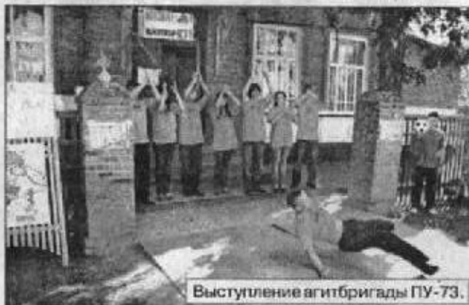
Выступление агитбригады ПУ-73.

Члены молодёжного Совета рассказали о себе, своих увлечениях, обращая внимание на то, что в их жизни нет места наркотикам и вредным привычкам. Юноши и девушки из агит-