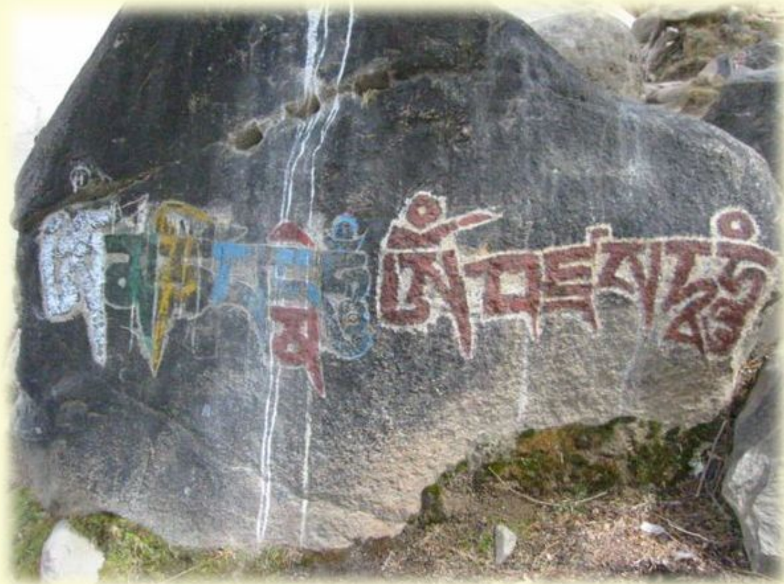
Мантра «Ом мани падме хум», записанная на камне современными буддистами. Тибет

Ом мани падме хум (О, жемчужина в цветке лотоса!) — одна из самых известных мантр в буддизме. Считается, что она олицетворяет чистоту тела, слов и разума Будды. Цитируя мантру, буддисты надеются пробудить природу Будды, которая, как они верят, есть в каждом человеке.