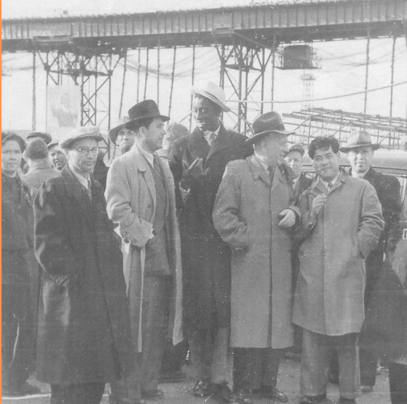
Африканская делегация Золотого Берега, бывшего владения Британской империи