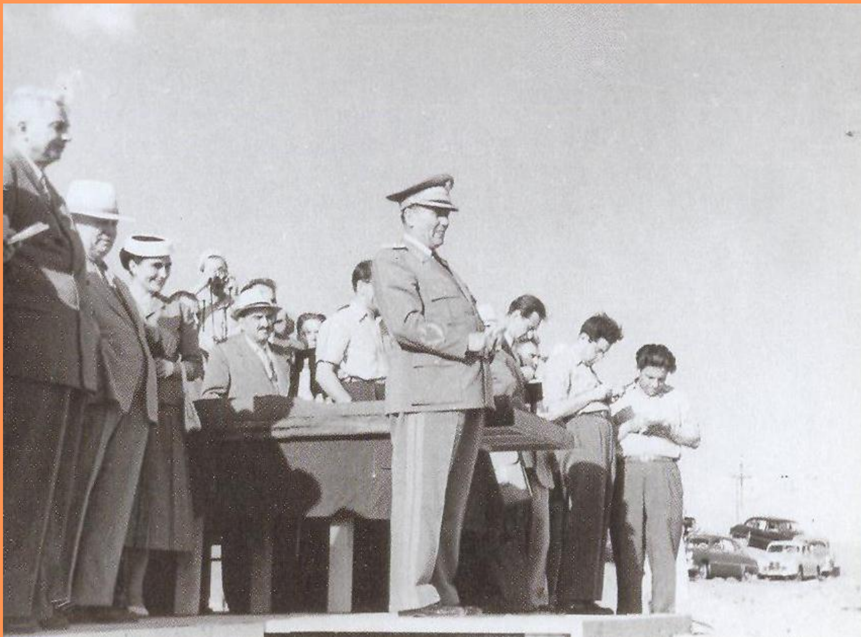
Иосип Броз Тито выступает с речью перед строителями шлюзов