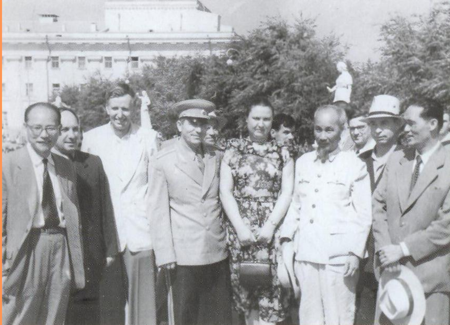
Хо Ши Мин тоже захотел посмотреть Волжский. Когда шли через парк, его остановили фотографы.