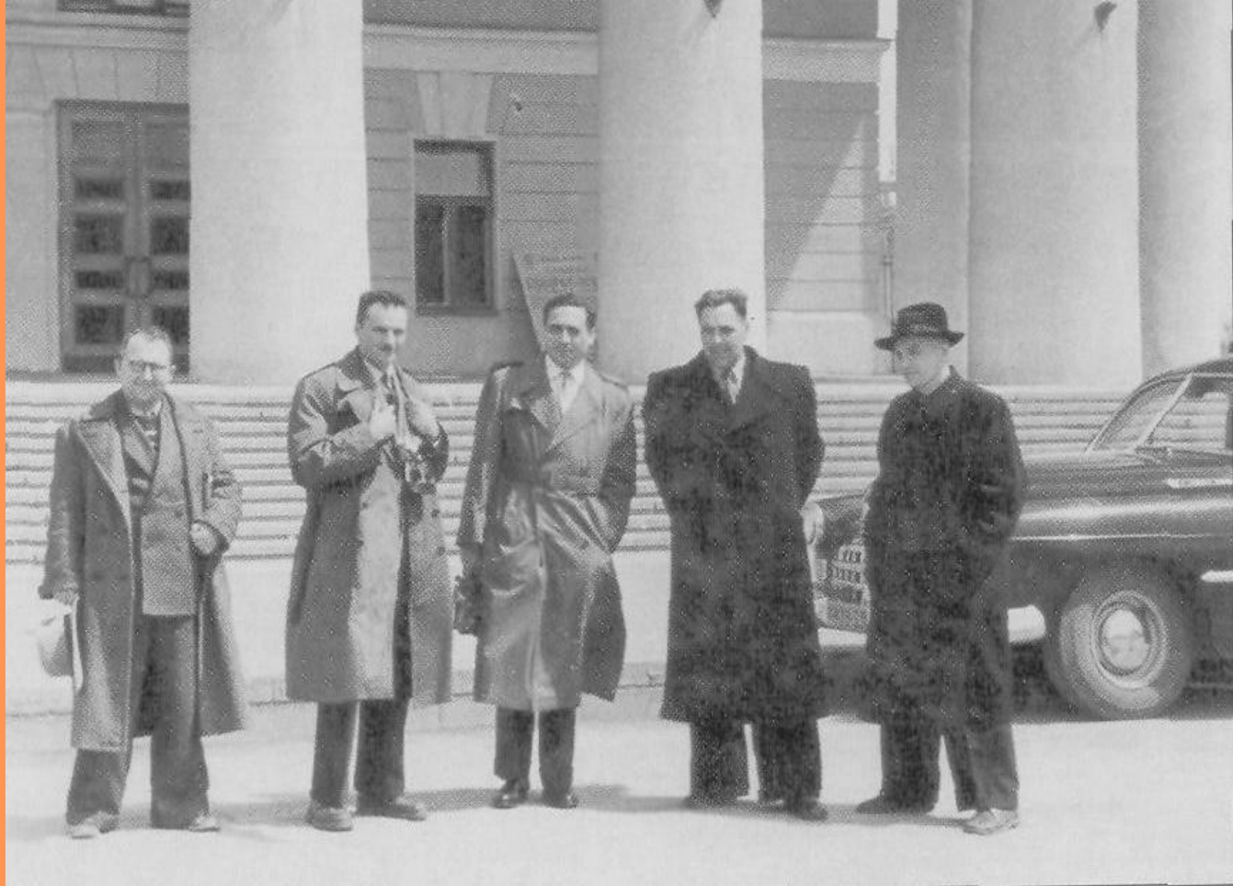
Французские экономисты по пути в Китай остановились в Волжском