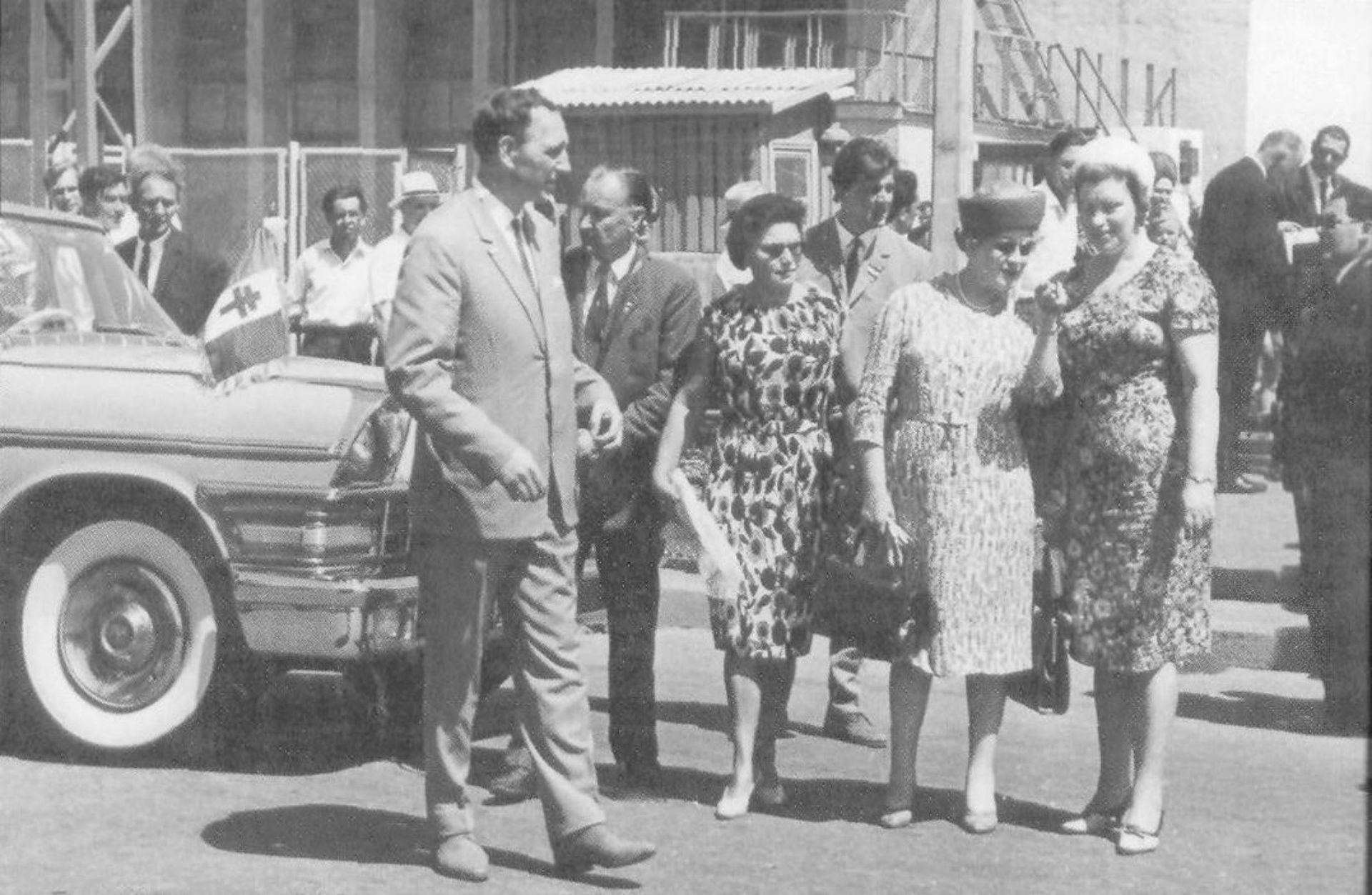
Вторая справа мадам де Голль