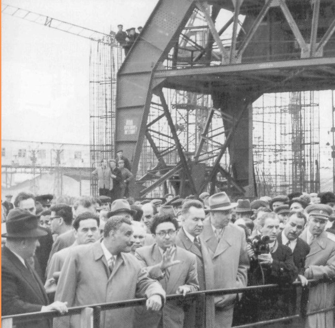
Президент Египта Насер на бетоновозной эстакаде. Правее его, за переводчиком – А. Н. Косыгин