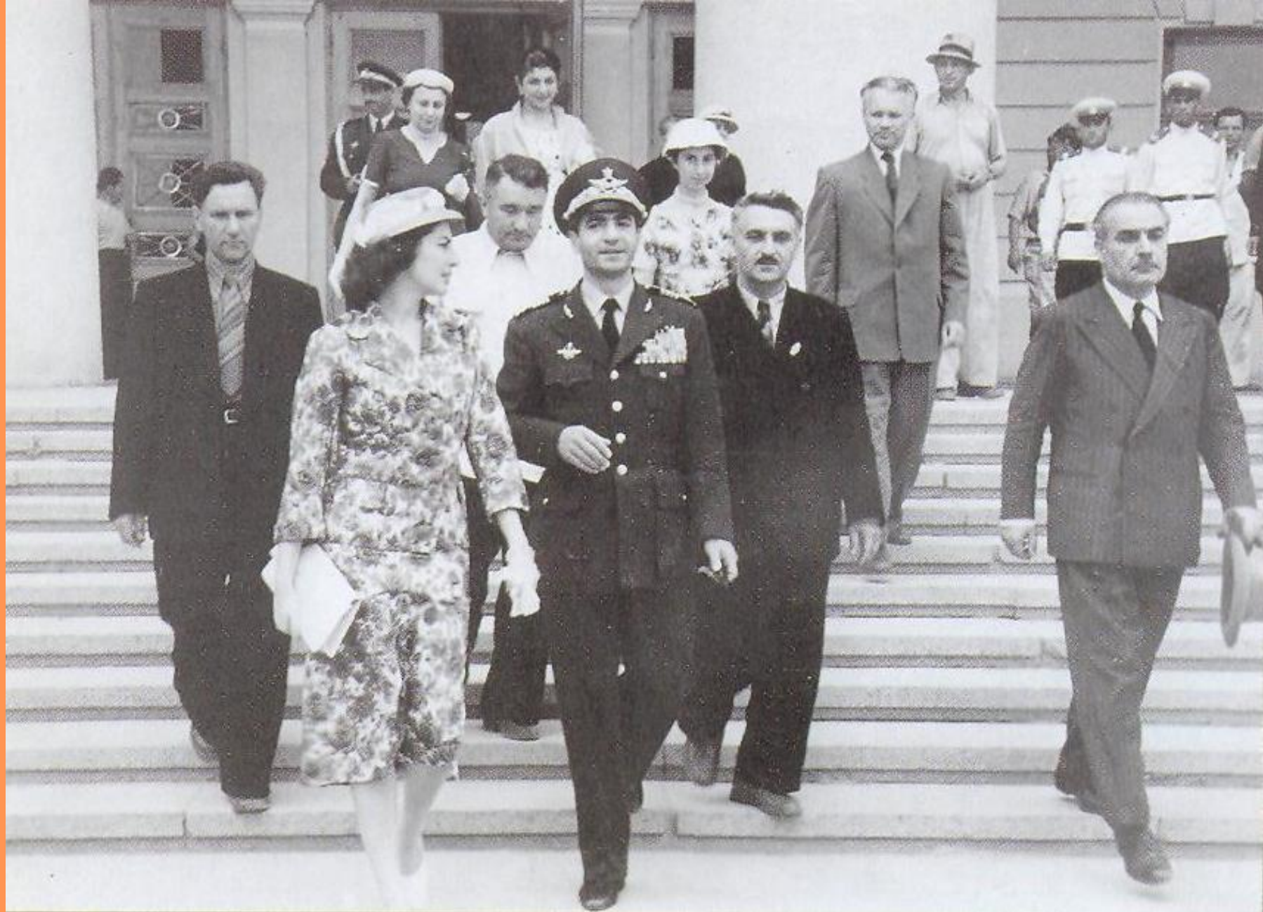
Шах Ирана Реза-шах Пехлеви с супругой в гостях у волжан.