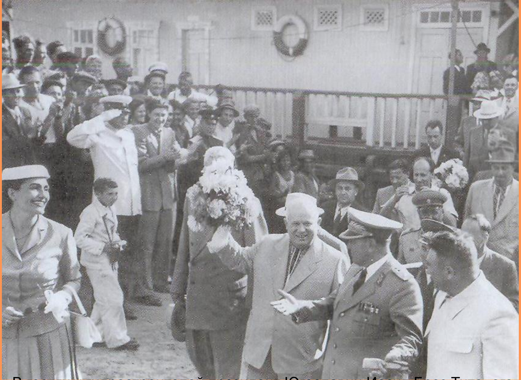
В гостях у гидростроителей президент Югославии Иосип Броз Тито, его супруга, первый секретарь ЦК КПСС, Председатель Совета Министров СССР Н. С. Хрущев. С хорошим настроением они сошли на левый берег Волги.