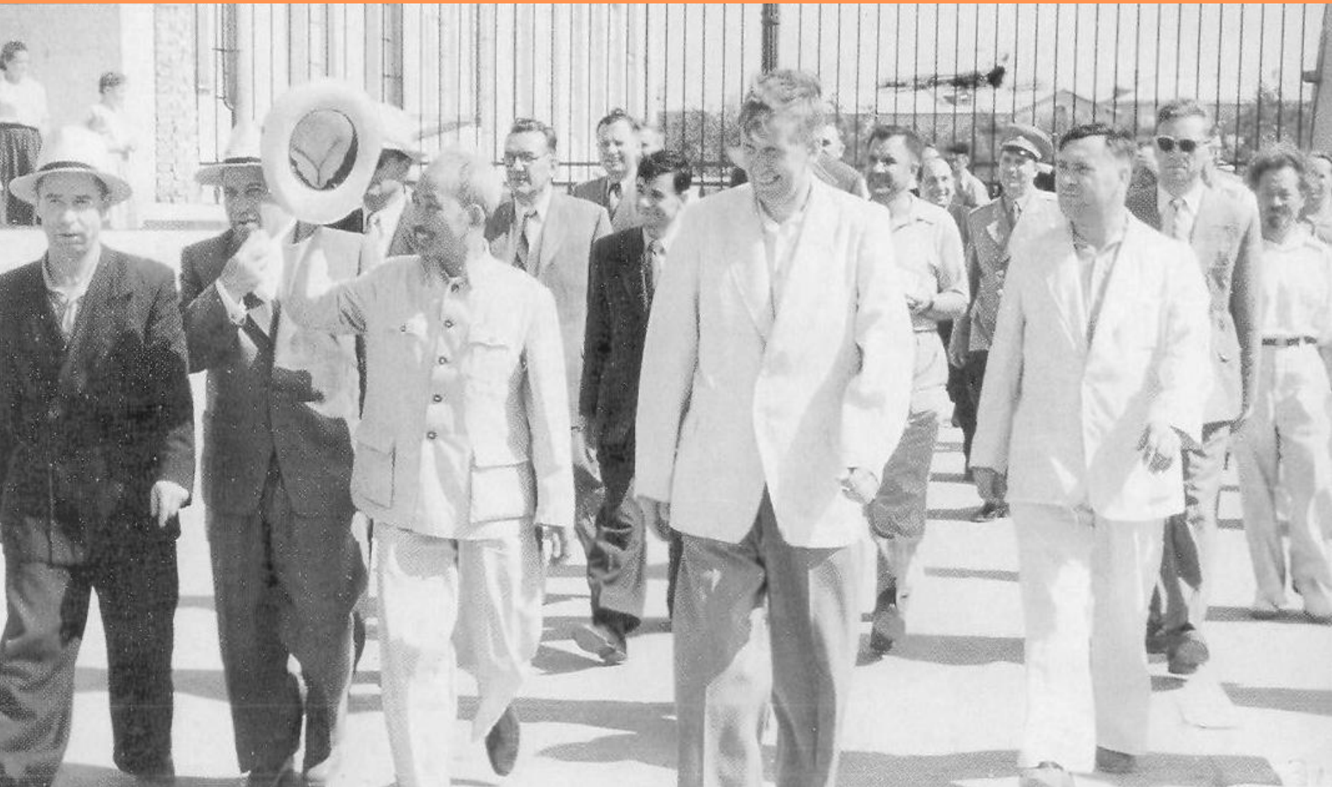
Прогулка по парку окончена. Время садиться в машину.