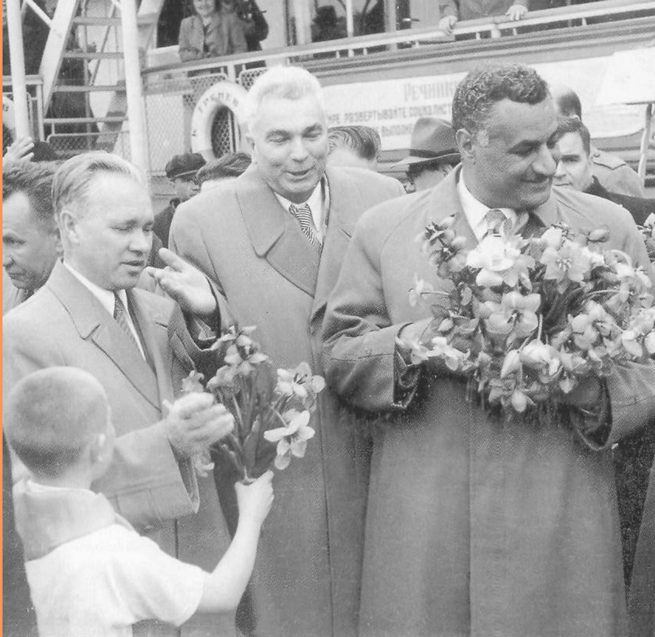
Гамаль Абдель Насер – вождь египетского народа. Он только что приплыл из Волгограда на пароходе и принимает на волжском берегу первые цветы и приветствия