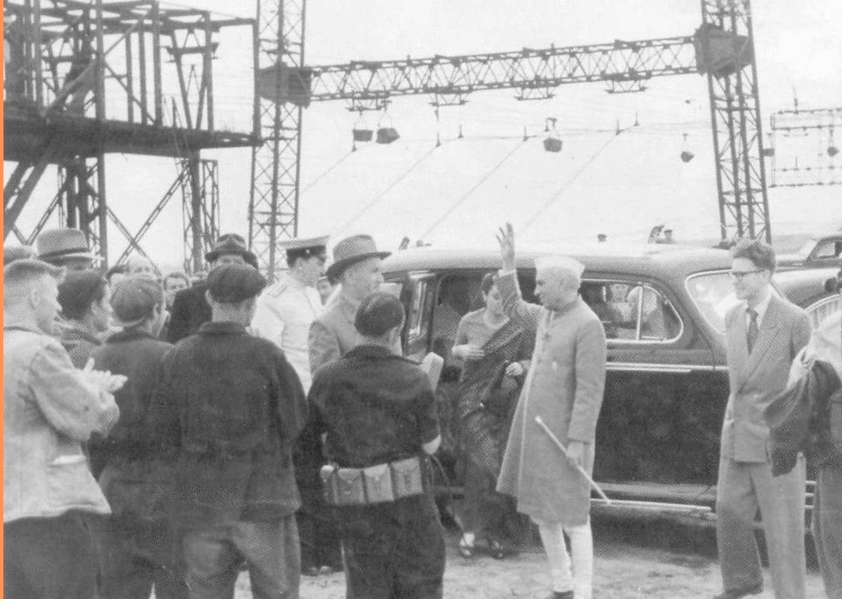
Последний взгляд на строительную площадку, и Неру спустился к народу. Павильон еще долго служил для встречи делегаций. Территория так и называлась: «Площадка Неру».