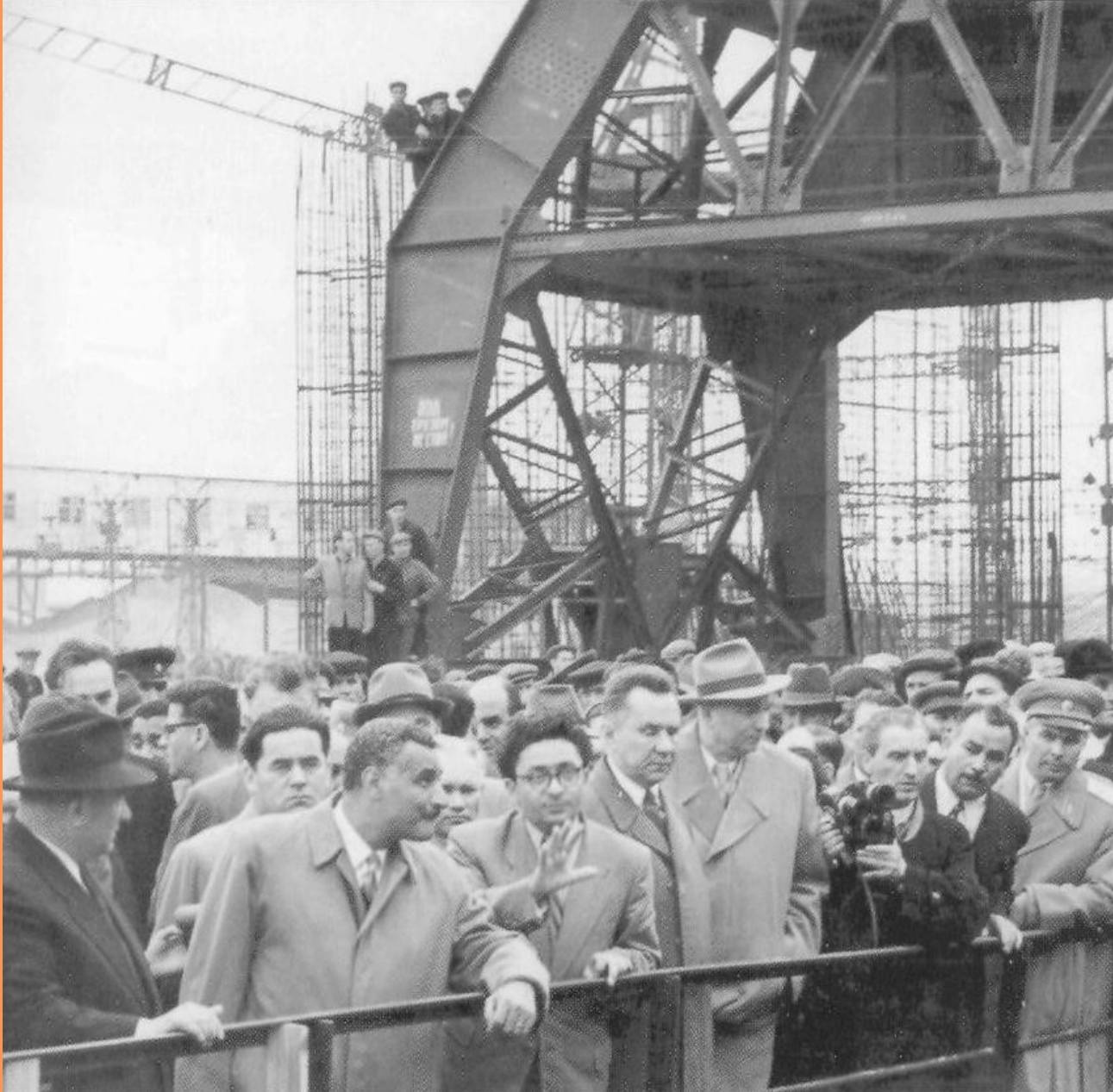
Президент Египта Насер на бетоновозной эстакаде. Правее его, за переводчиком – А. Н. Косыгин