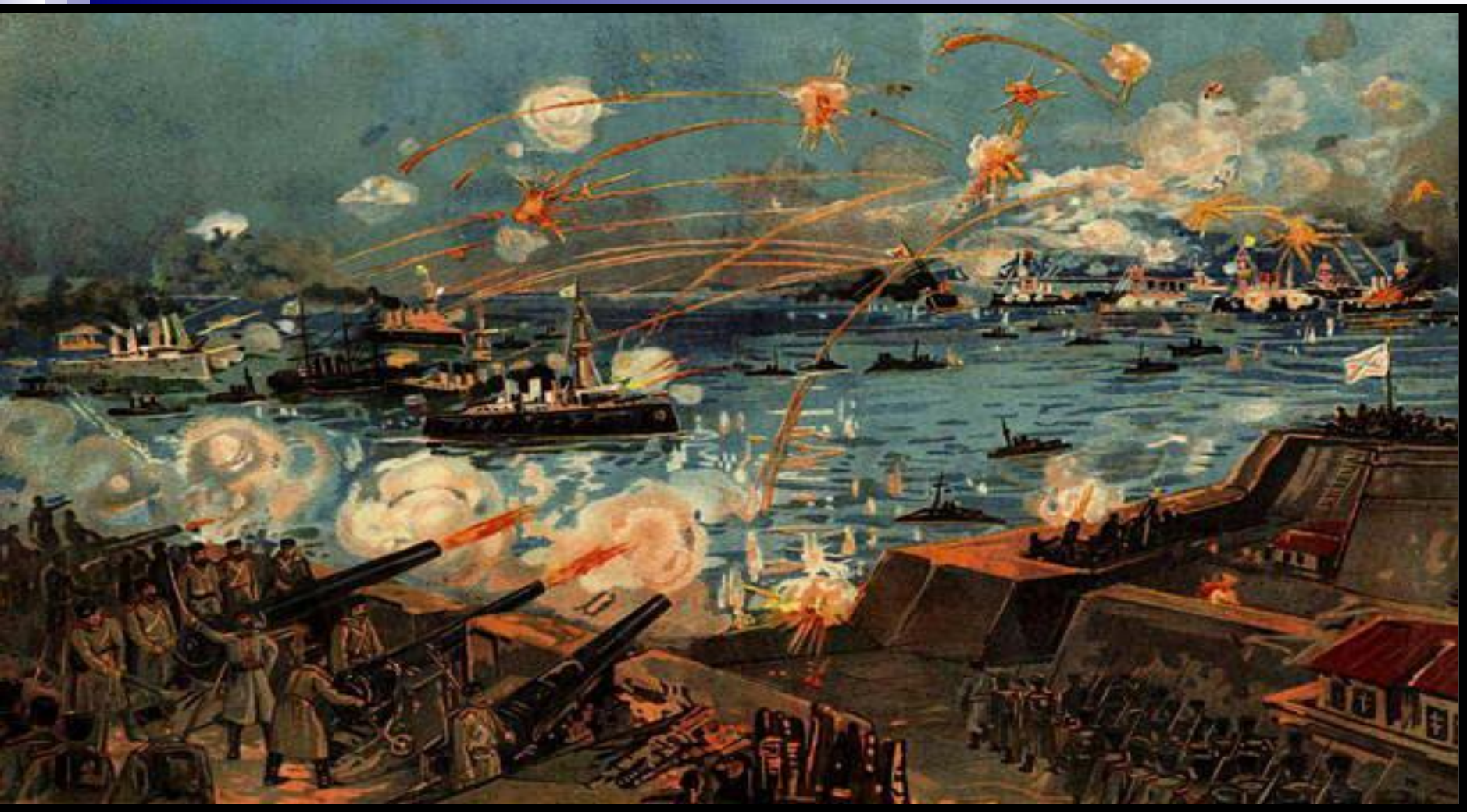
Морское сражение у Порт-Артура. Литография, 1904 г.