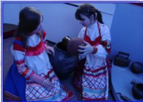
Описание музейного предмета.