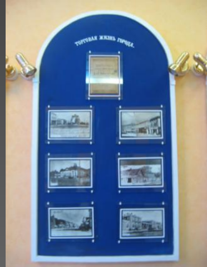
Торговая жизнь города

Старый базар (который находился где современная пл. Свободы) постепенно утратил свое значение и основная торговля перемещается к площади Нового базара (современной пл. Ленина). На пересечении Астраханской и Владимирской улиц (современная улица Свободы) в конце XVIII построили Гостиный двор, где предполагалось разместить лучшие торговый заведения. На Почтовой улице и прилегающих кварталов Астраханской и Московский улиц располагались лучшие магазины города.