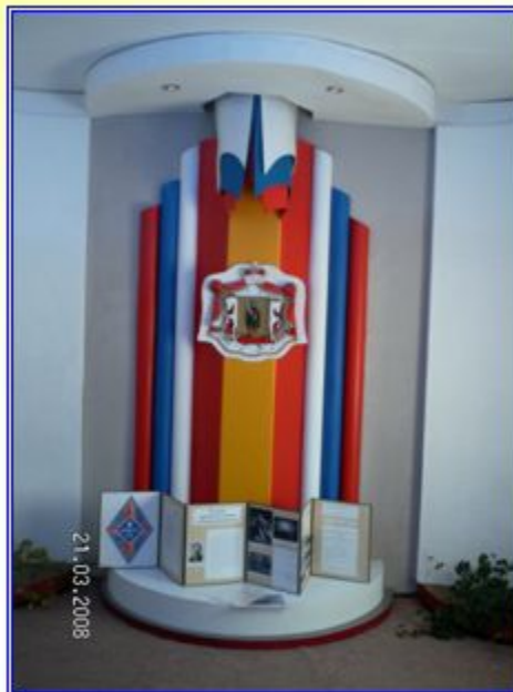
Символика Рязанской области в одном из залов музея

Адрес: 390039, г. Рязань, ул. Бирюзова, д. 19А www.ryaz.ru/school/35 Телефон/факс: (4912) 36-45-00