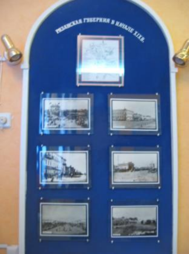
Рязанская губерния в начале XIX-XX века