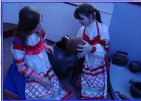
Описание музейного предмета.