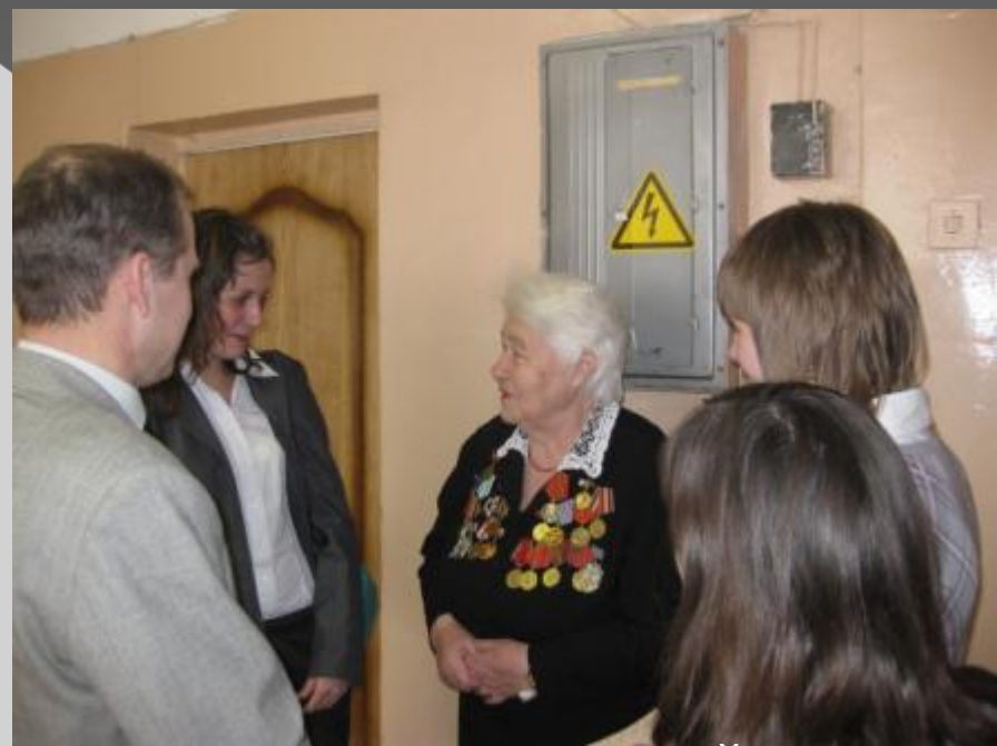
Школьная конференция «Победу делают пополам: живые и мертвый»