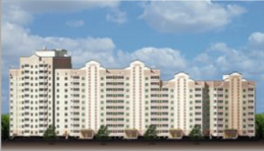
Жилое здание. Санкт-Петербург. 20 век. Монолит.

Строительство модульных зданий (Великий Новгород) 21 век