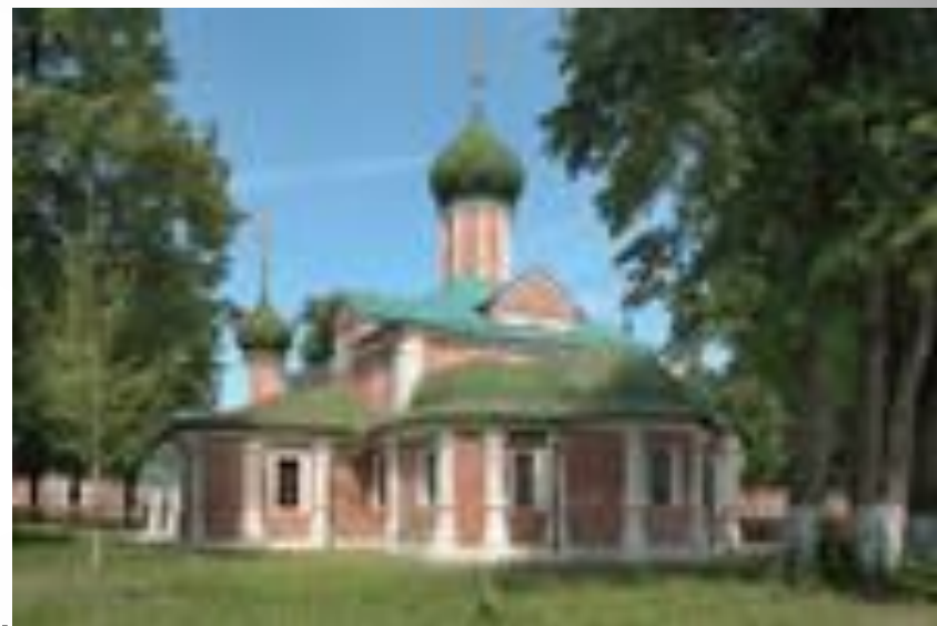
Феодоровский монастырь в Переславле-Залесском Ярославской области. Введенская церковь и надкладезная часовня.16 век.