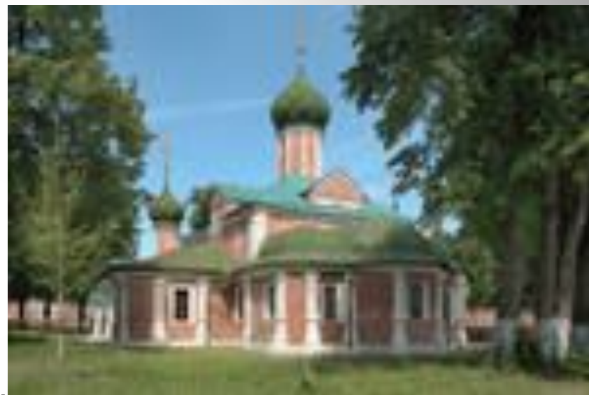
Феодоровский монастырь в Переславле-Залесском Ярославской области. Введенская церковь и надкладезная часовня.16 век.