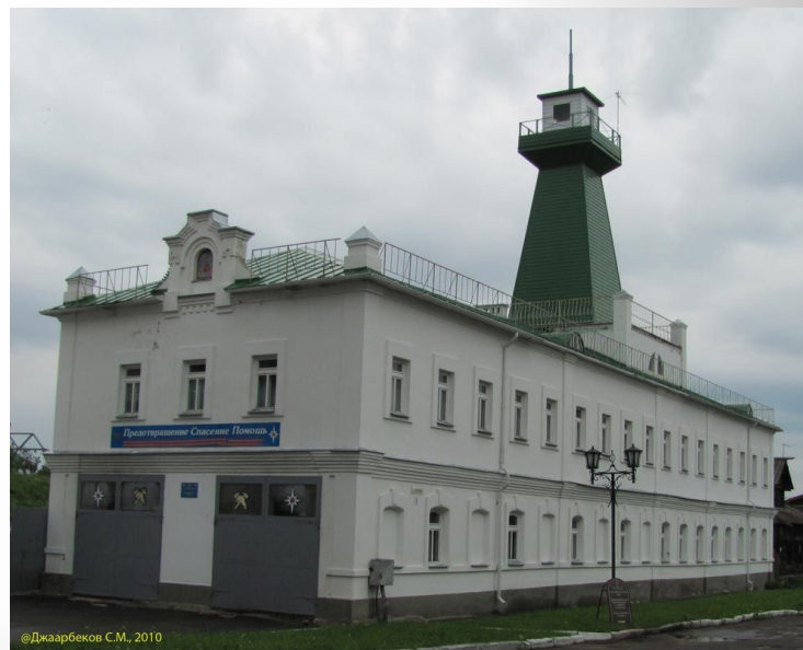
Здание пожарной части. Суздаль, 19 век. Построено из камня и кирпича.