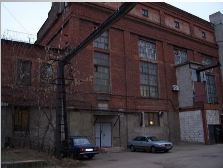
Промышленное здание. Санкт-Петербург. 19век. Построено из камня и кирпича.