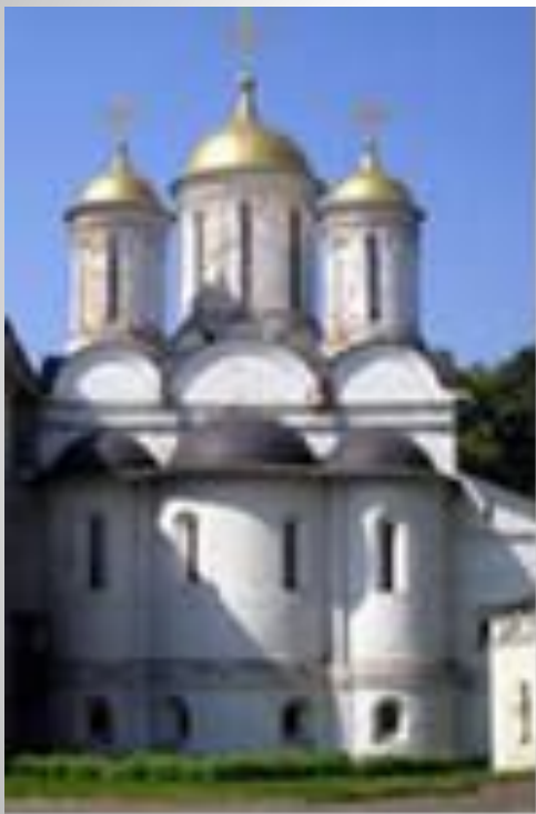
Мемориальное здание. Ярославль 16 век. Сделано из кирпича.

В разные века, в разных странах строили очень разные здания. То, каким будет здание, зависит и от климата страны, и от того какой строительный материал есть под рукой, и от верований людей строящих это здание, и от предназначения самого здания, и от уровня культуры народа.