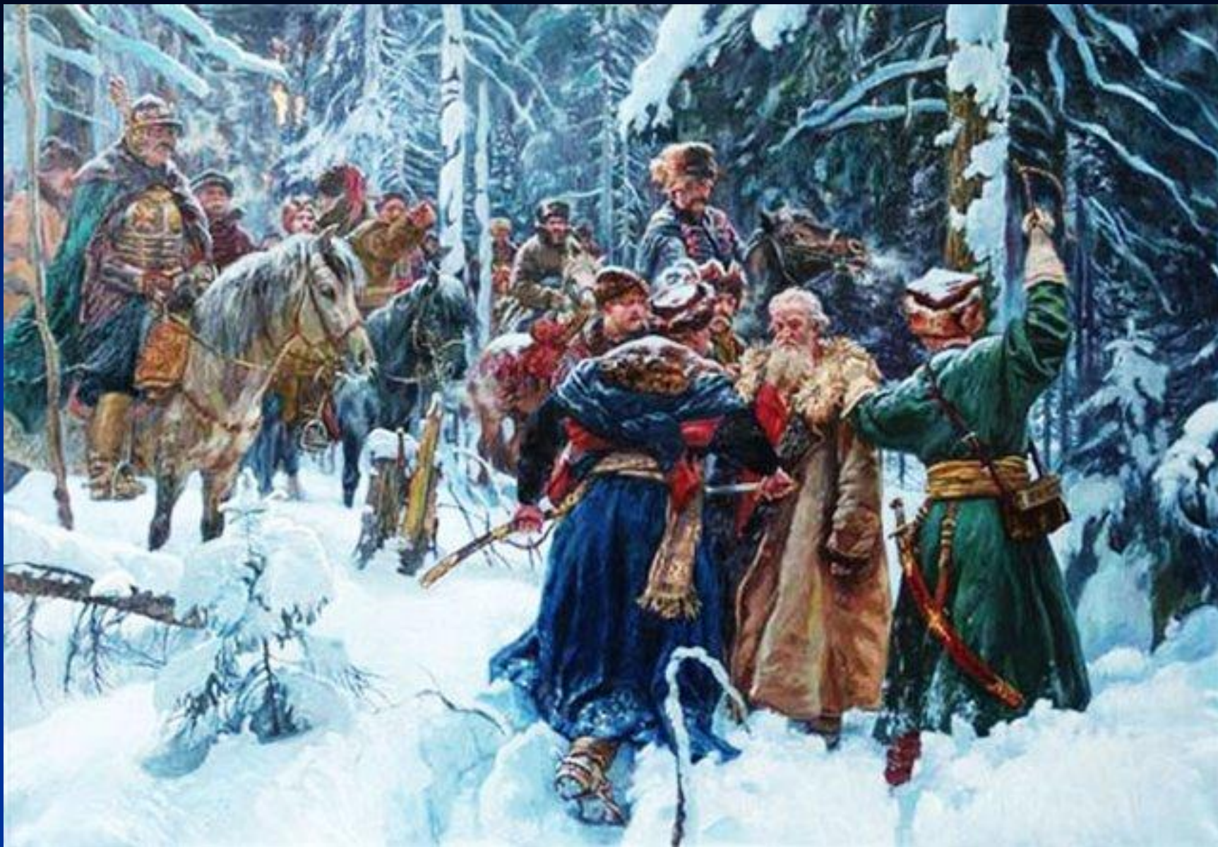
Подвиг Ивана Сусанина