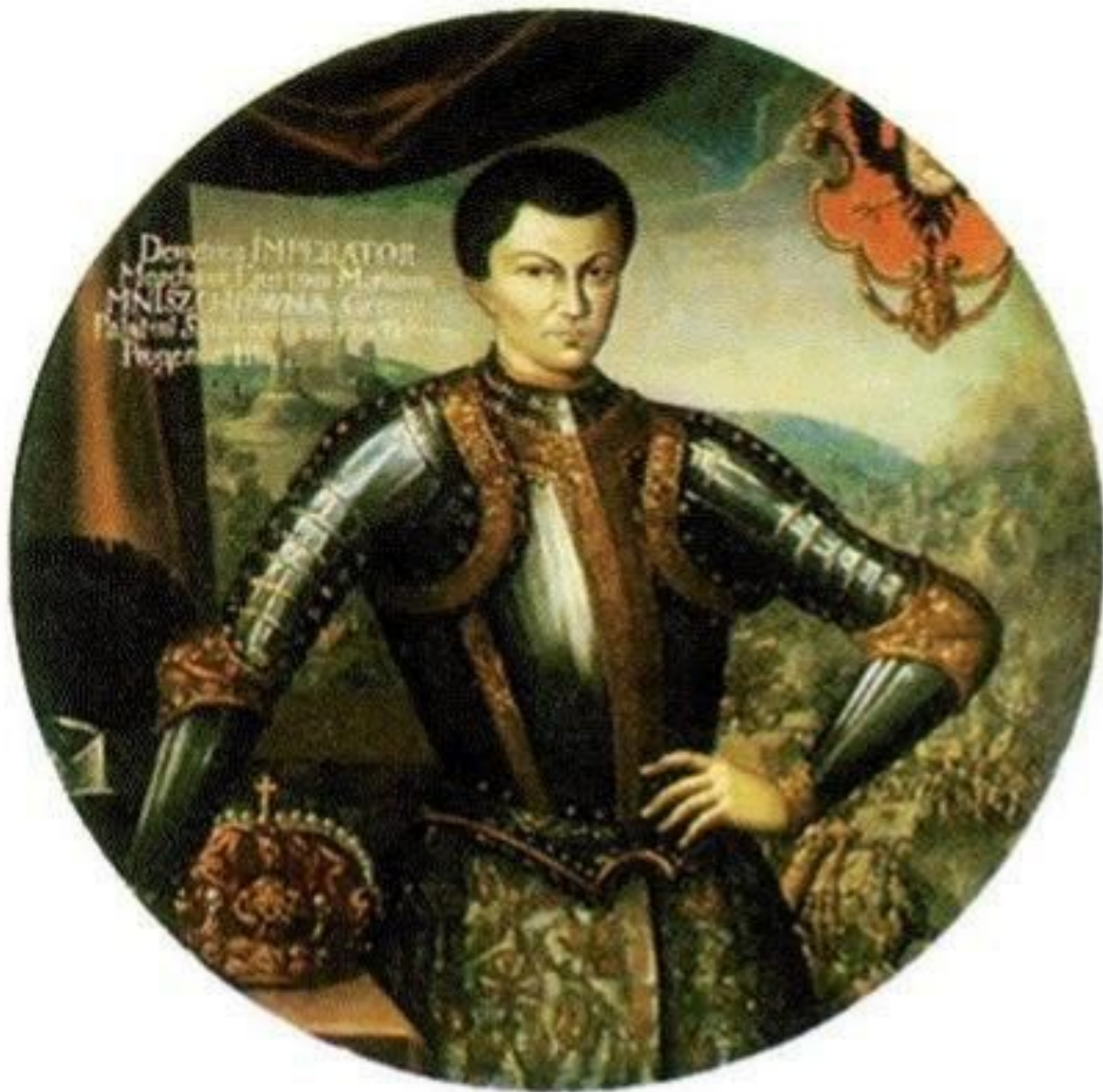
Иван IV Иванович