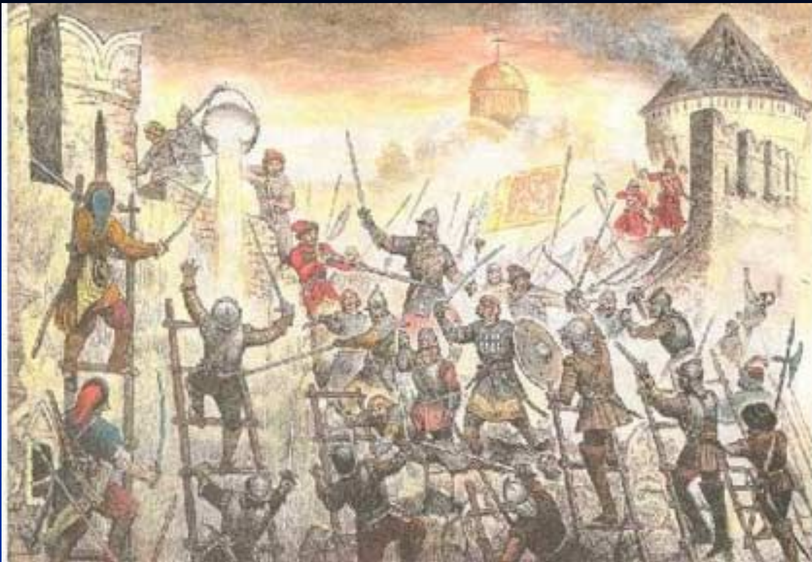
Штурм Смоленска 3 июня 1611 г