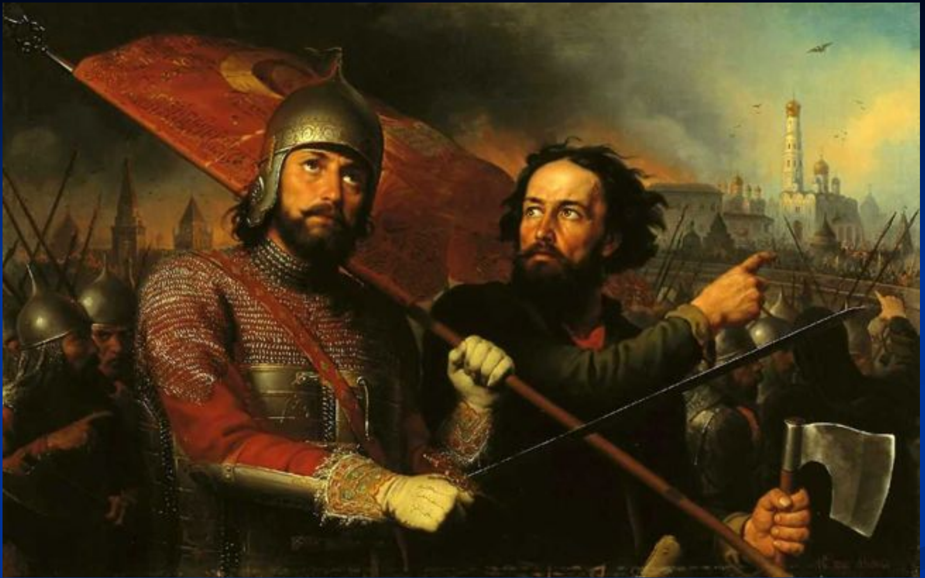
Минин и Пожарский