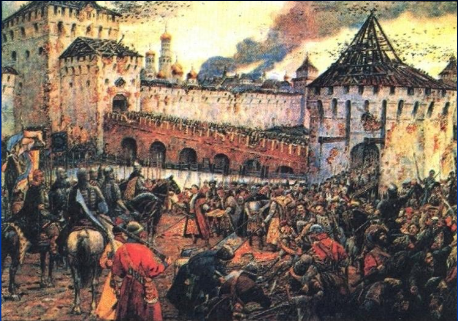
Изгнание польских интервентов из Московского Кремля