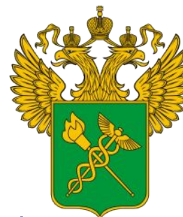
Федеральная таможенная служба