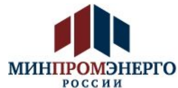
Министерство промышленности и энергетики