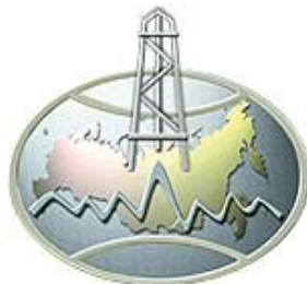
Министерство природных ресурсов