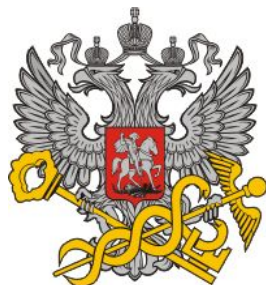
Федеральная налоговая служба