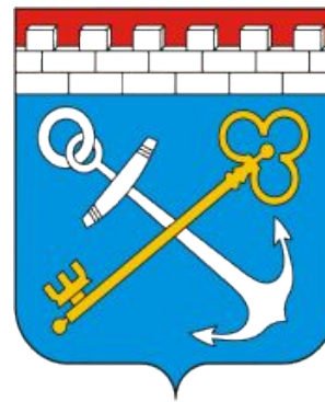
Правительство Ленинградской области