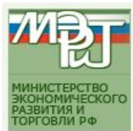
Министерство экономического развития и торговли