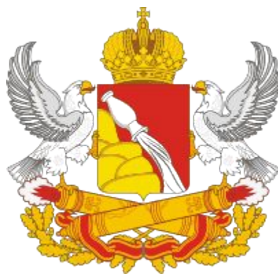
Администрация Воронежской области