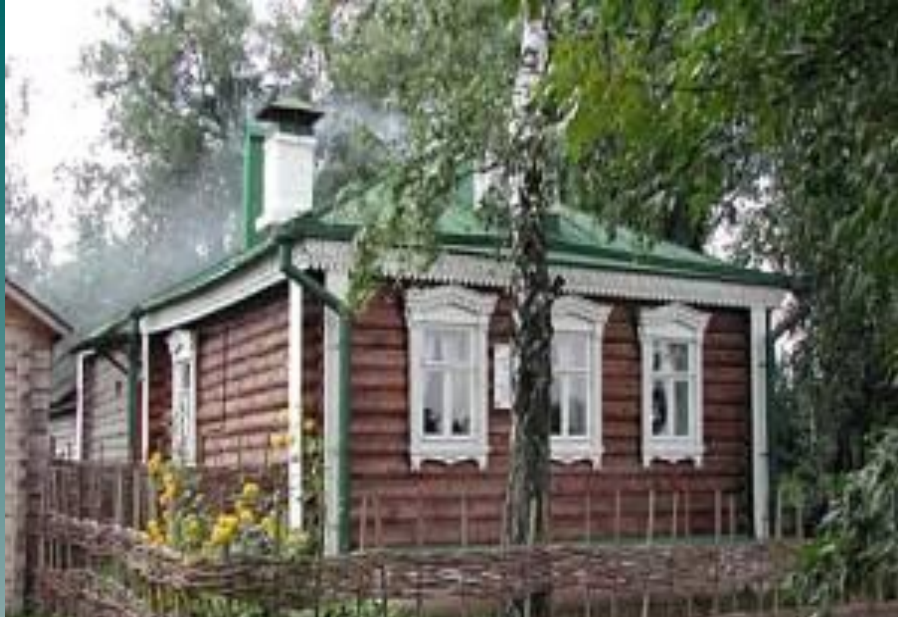
Крестьянская усадьба родителей поэта. Уютная бревенчатая изба.