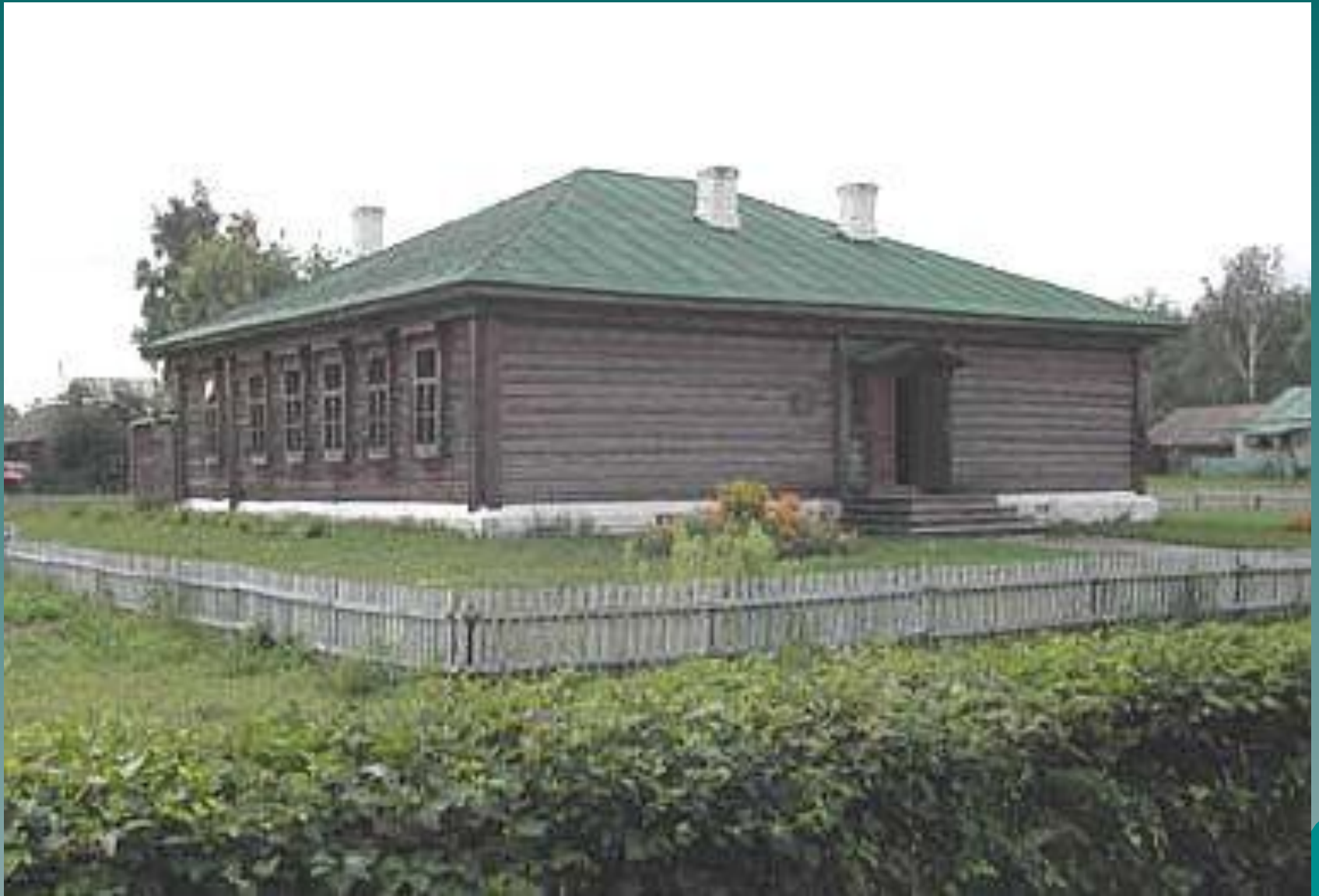
Школа, в которой учился Есенин