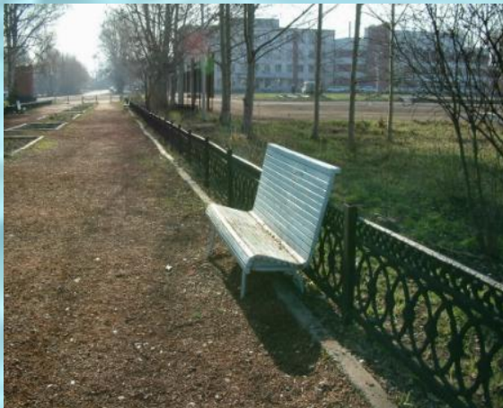
← Der Park, die Bank ("e)