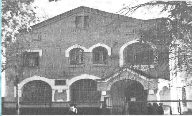
ул. Интернациональная, 8