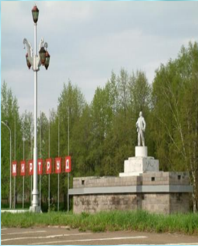
← Das Lenin-Denkmal