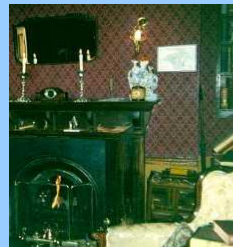
Дом Шерлока Холмса