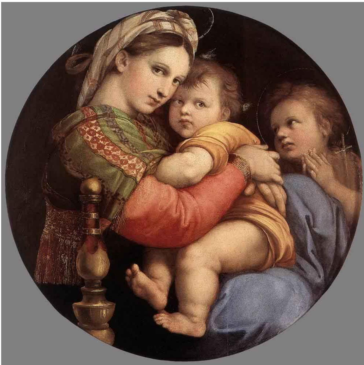
Мадонна с ребёнком. Рафаэль