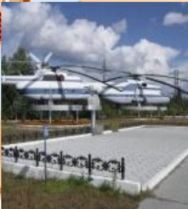
Аллея Почета авиационной техники