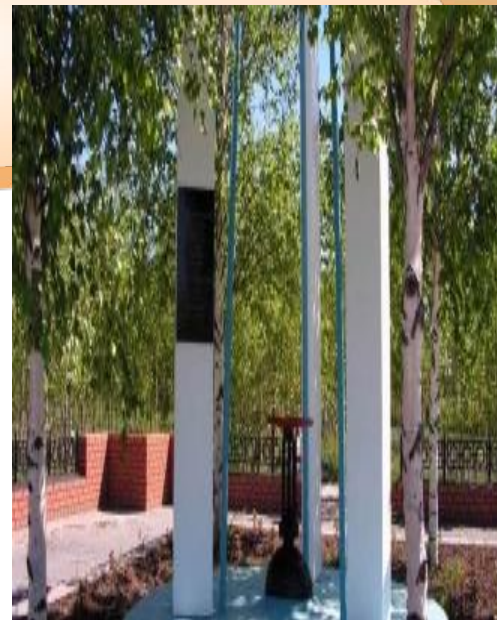
Памятник первой нефтяной скважине