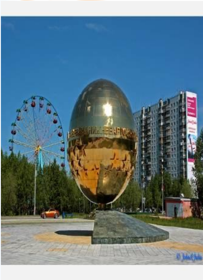
Памятник звёздам нижневартов ского спорта