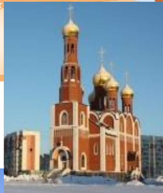
Храм Рождества Христово