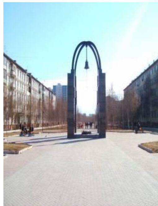
Памятник воинам- интернационалиста м