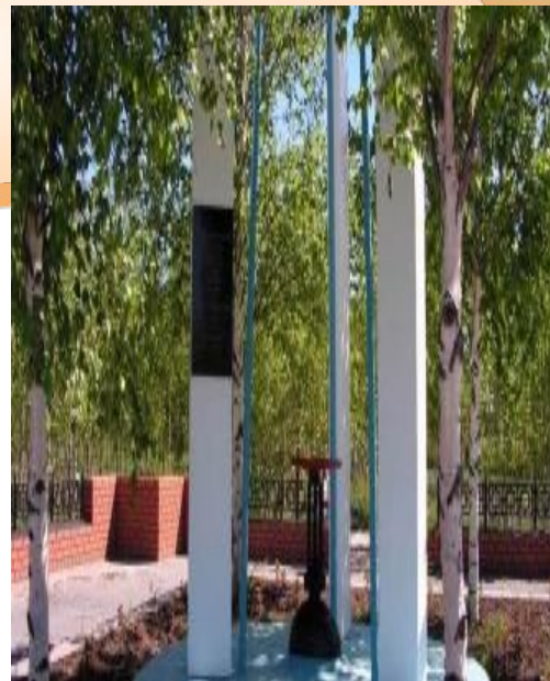
Памятник первой нефтяной скважине