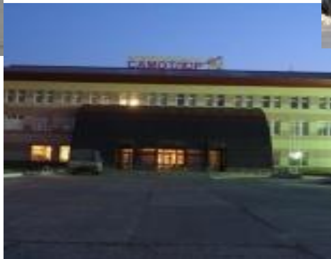
Зал международных встреч