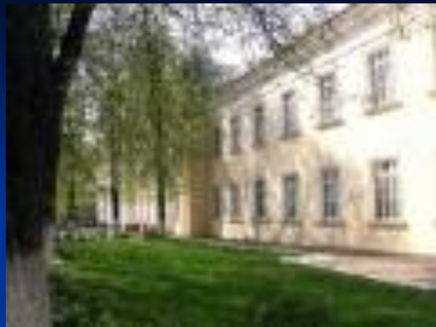
Дом культуры железнодорожников