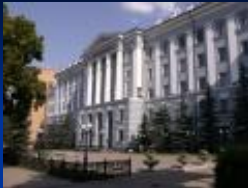
Здание офиса Тулa регионгаз