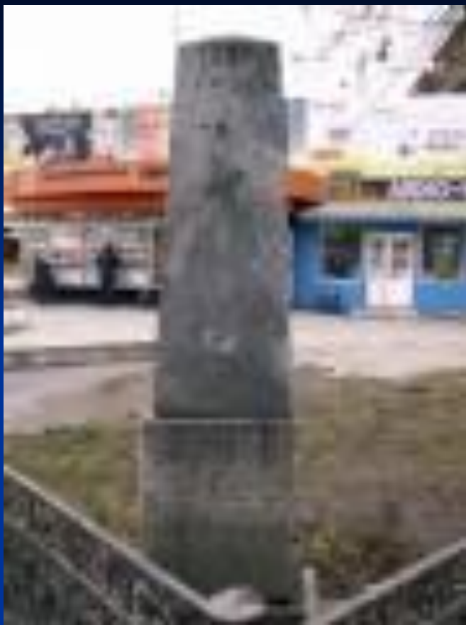
Камень на площади Восстания