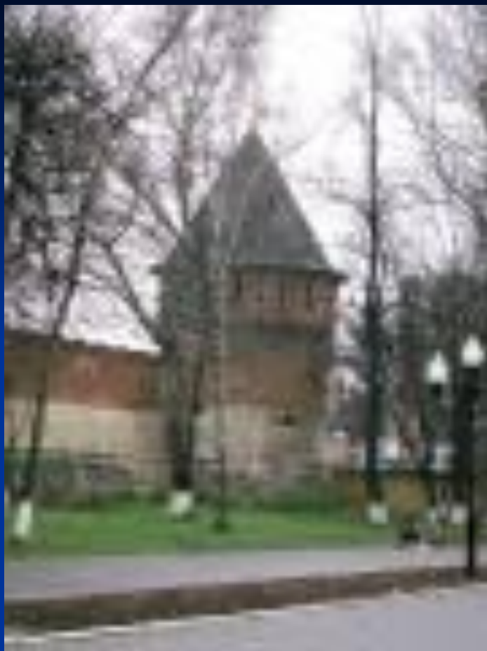
Башня Тульского кремля