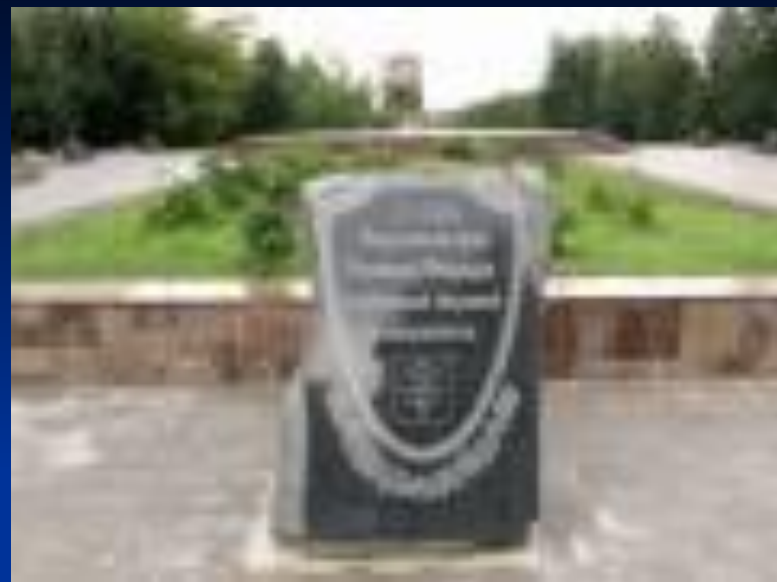
Камень памятник советско- чехской дружбе