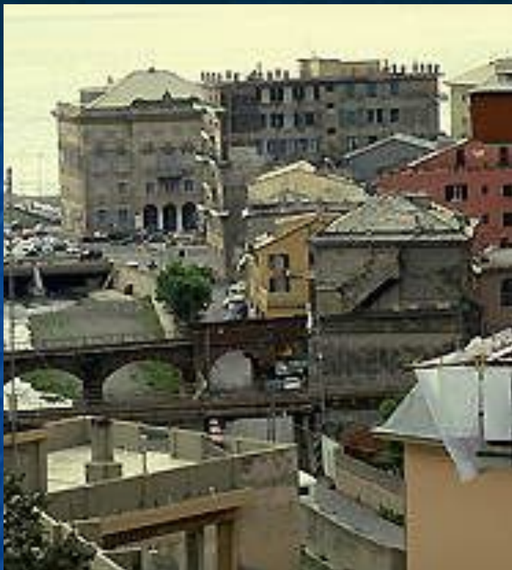
ГЕНУЯ. ПРИБРЕЖНЫЙ РАЙОН