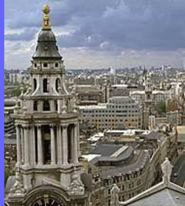
Собор Св. Павла

• Религия. Официальной церковью в Англии является Англиканская церковь, насчитывающая 26 млн. прихожан. Официальная Шотландская церковь организована по пресвитерианскому принципу и объединяет 1 млн. верующих. Другие протестантские церкви, из которых самая крупная – методистская, насчитывают 1,6 млн. верующих. Имеется также около 5 млн. приверженцев Римско-католической церкви, 830 тыс. мусульман и 400 тыс. иудеев.