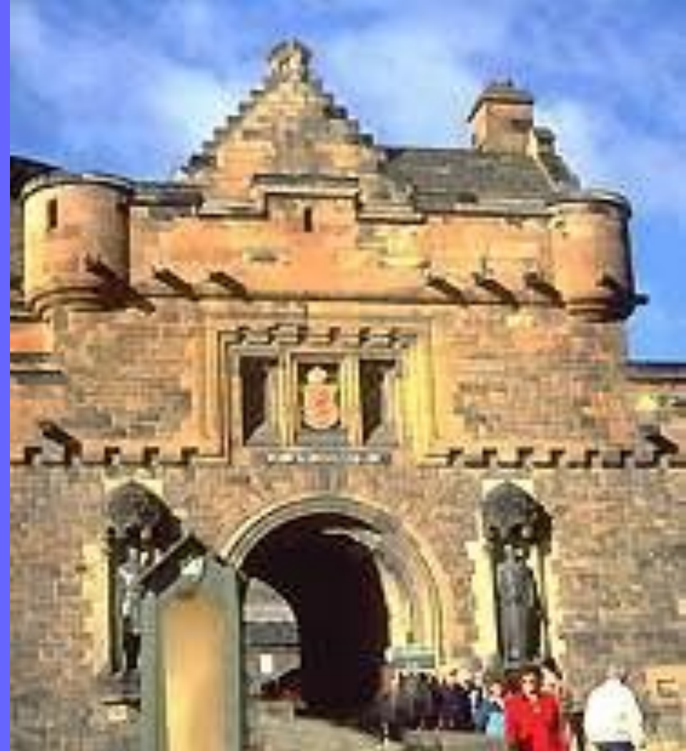
Ворота бывшего королевского замка. Холируд.