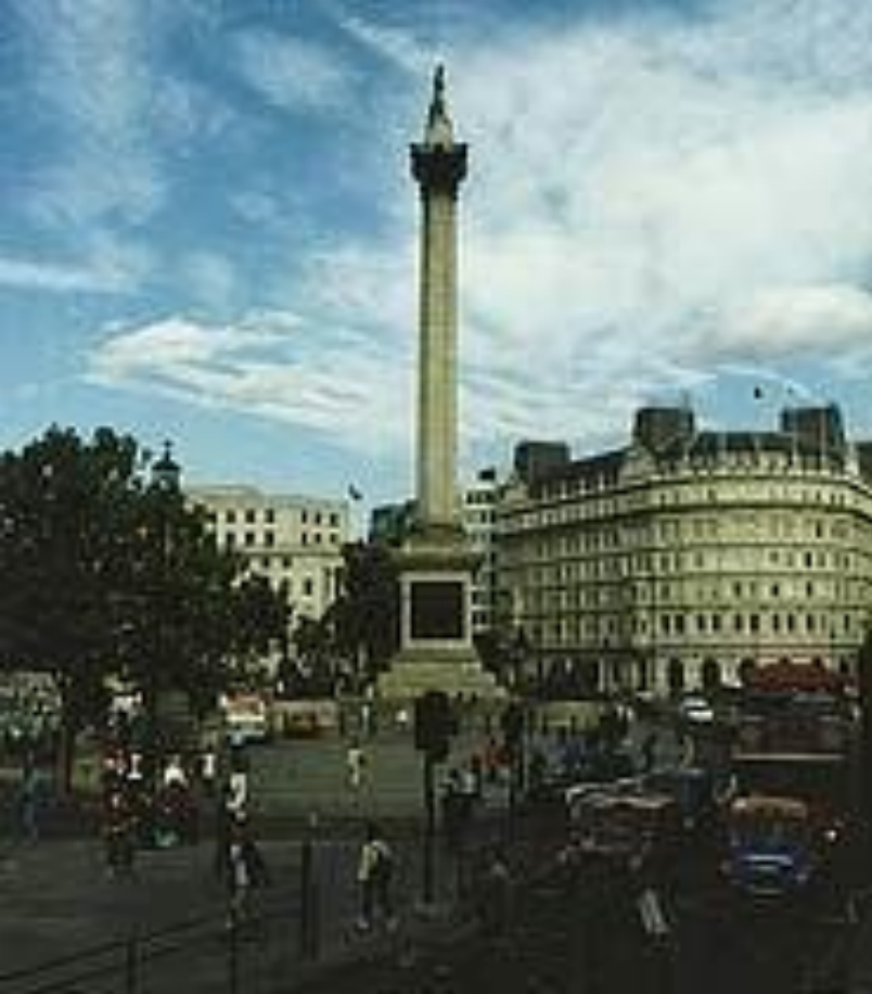
Колонна Нельсона на Трафальгарской площади.

Трафальгарская площадь – главная площадь Лондона, откуда отсчитываются расстояния во все концы страны. В Глазго интересны собор Св. Мунго (1136-сер. XV в), музей Глазго, художественная галерея, ботанический сад и зоопарк.