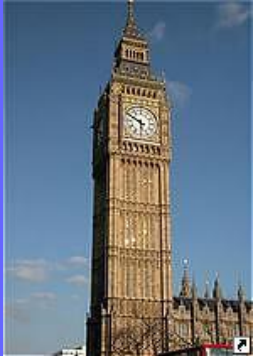
Биг - Бен