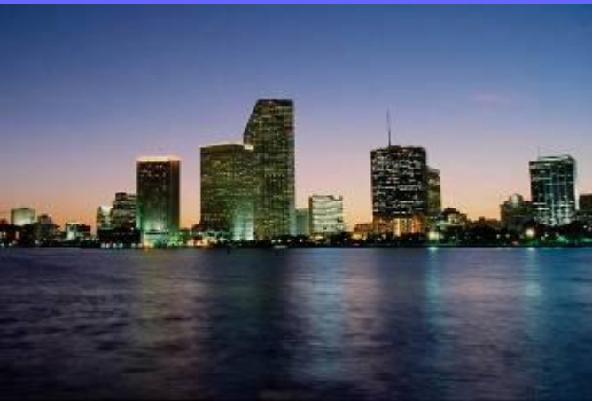
Вечерний вид Лондона.