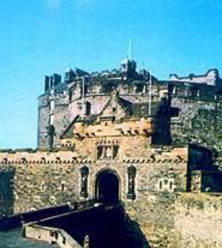
Бывший королевский замок. Холируд.