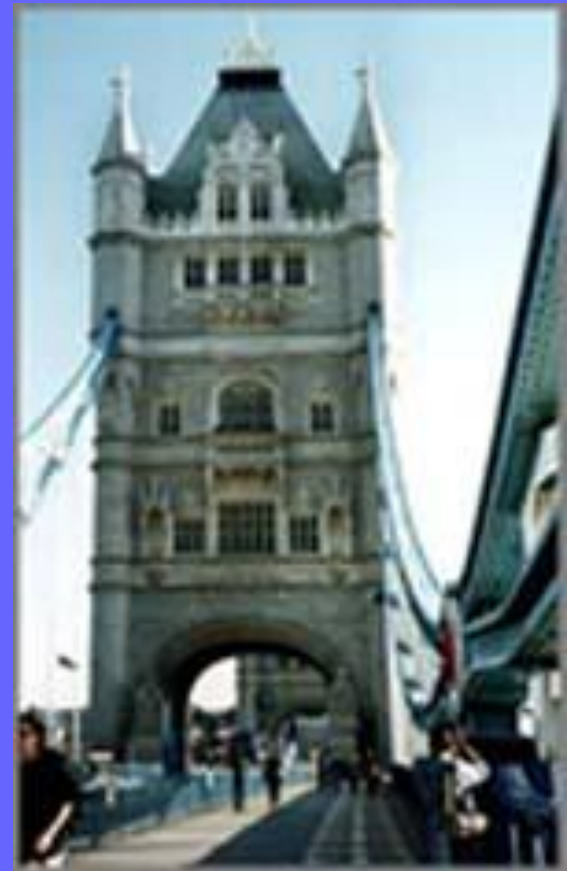
На мосту Лондона.