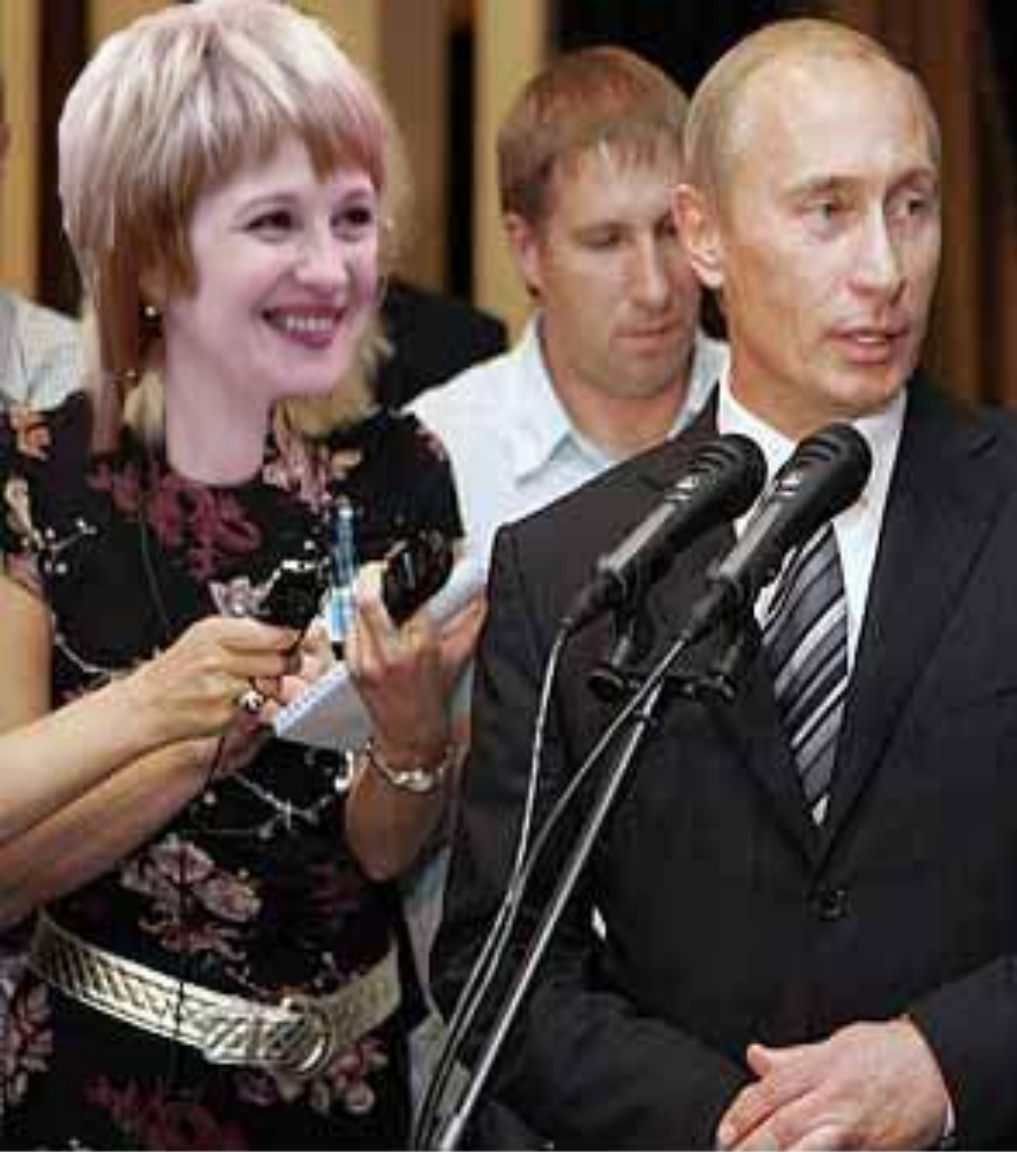
Владимир Путин во время пресс-конференции в Абу-Даби.

Что вы блистательны, умны Для многих не секрет. Для экс- президента всей нашей страны Вы – большой авторитет