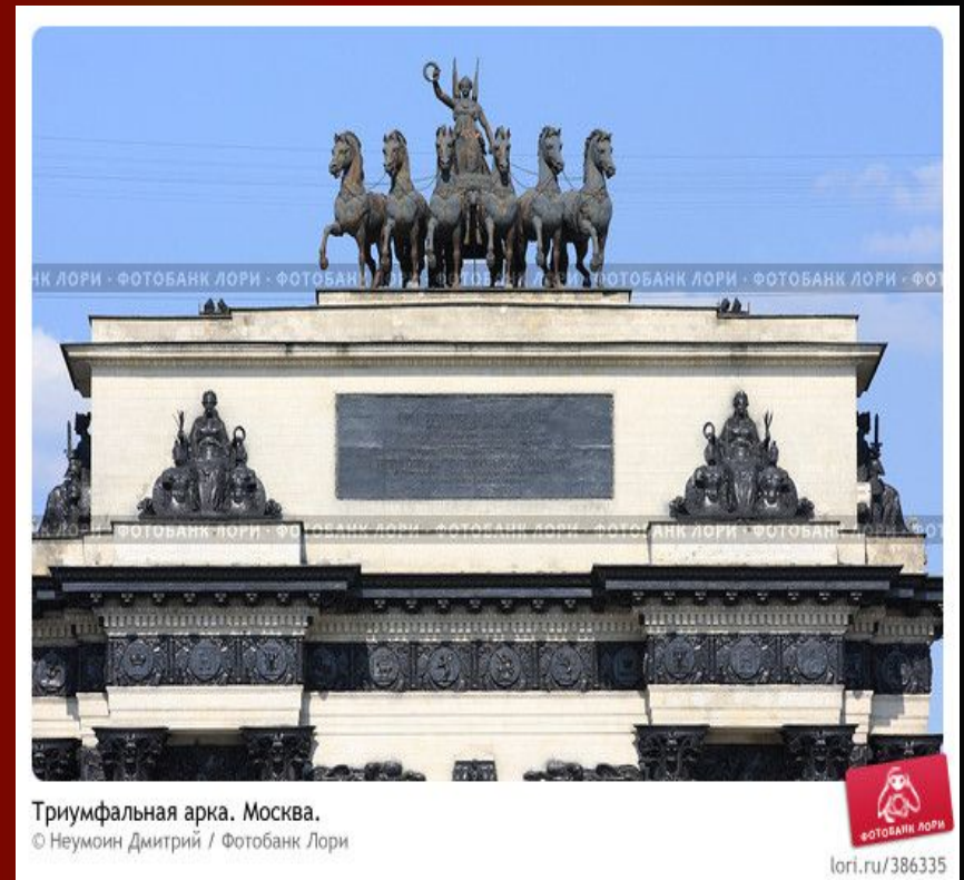
Триумфальная арка. Москва.