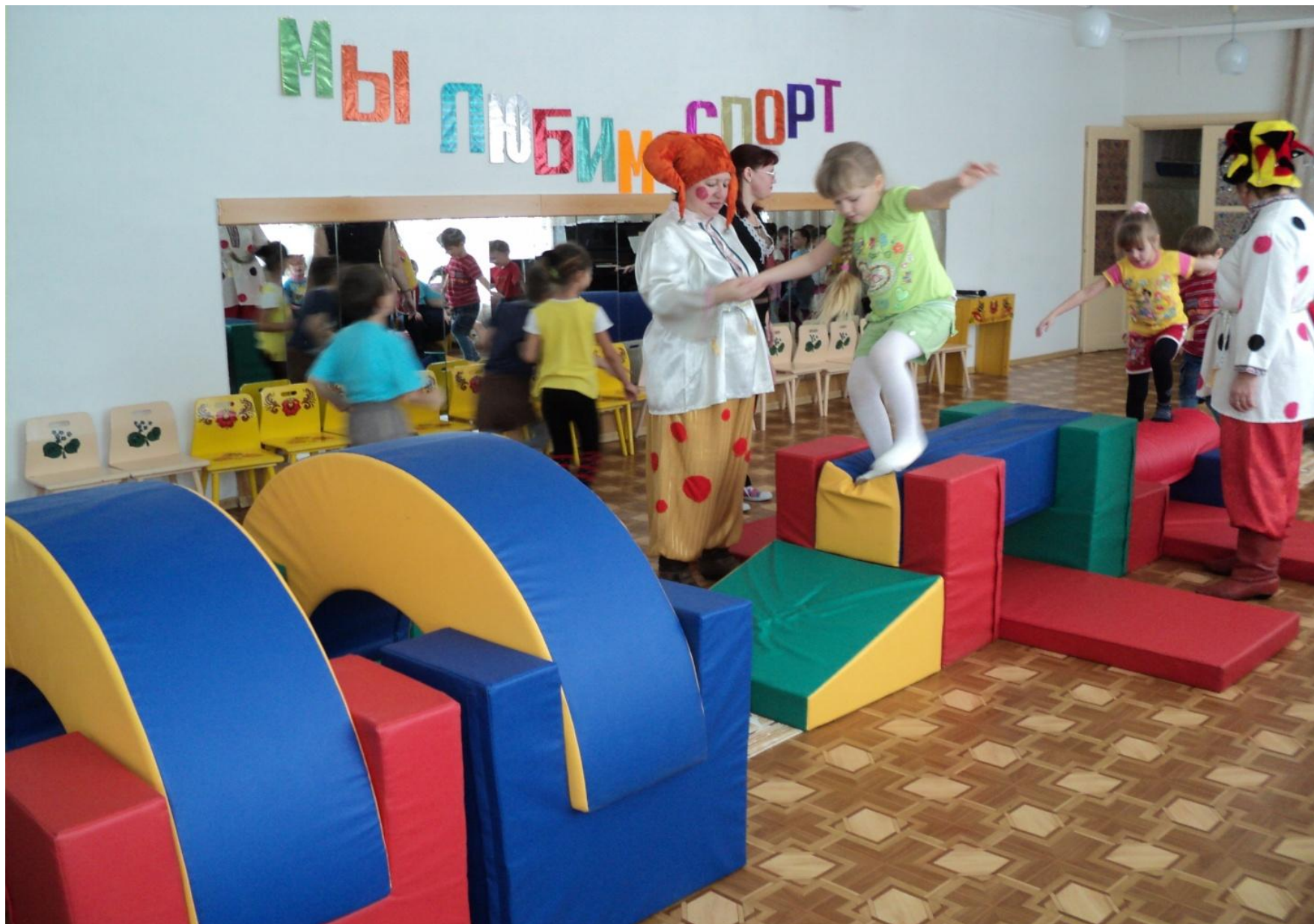
Интернет-конкурс «Моя педагогическая инициатива-2011»