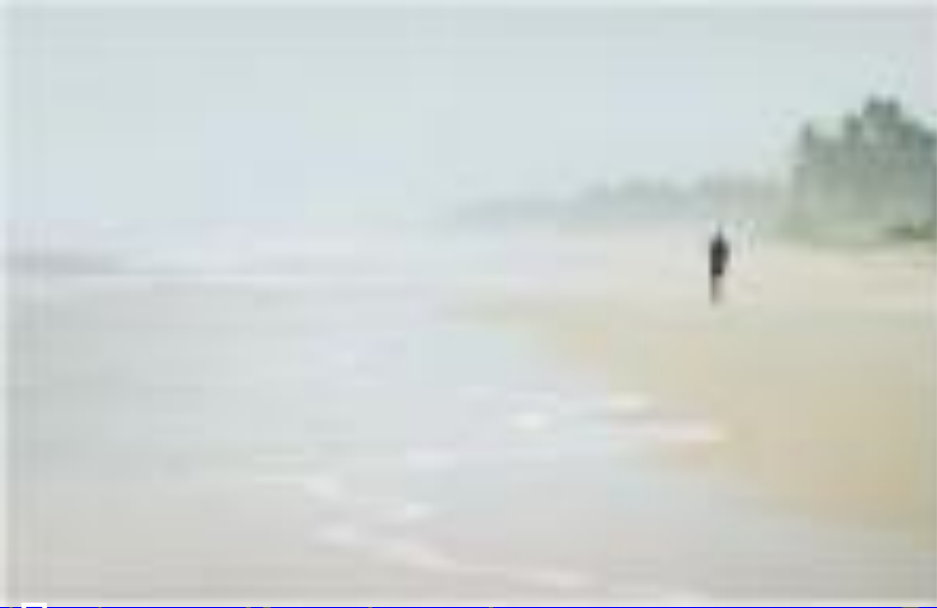
Пыль, возникающая вследствие испарения капель морской воды.