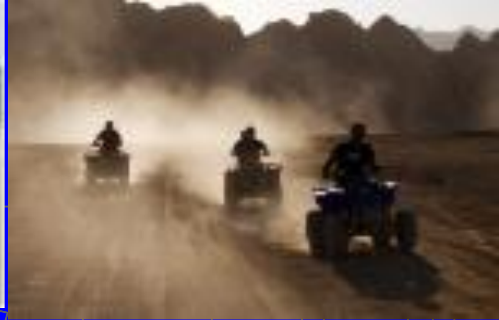
Пыль возникающая при ветровой эрозии почвы