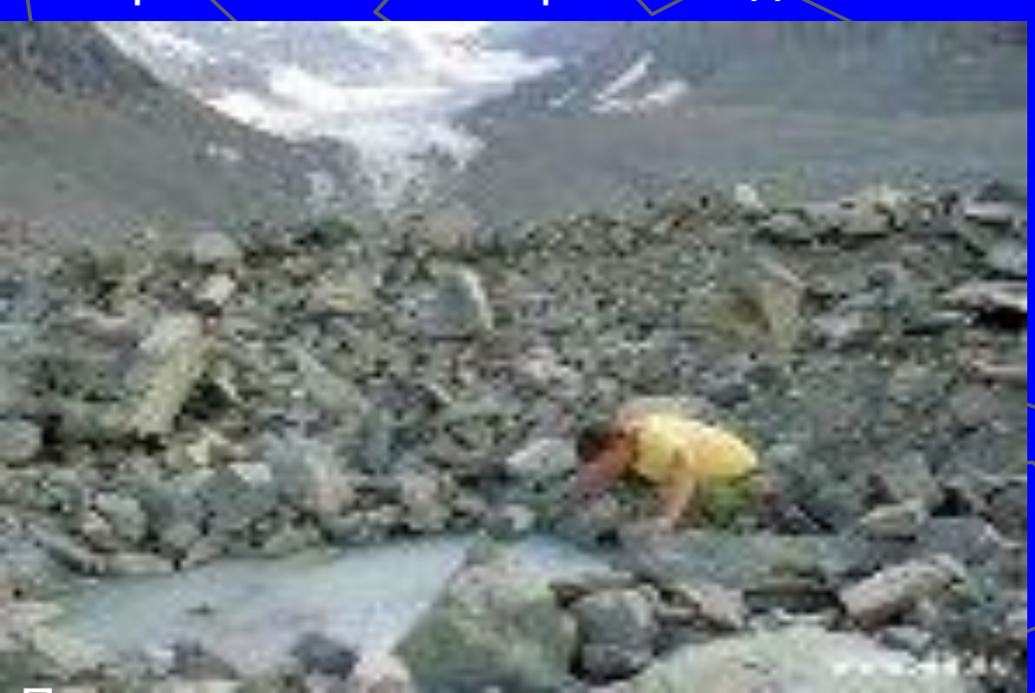
Пыль, возникающая при выветривании горных пород