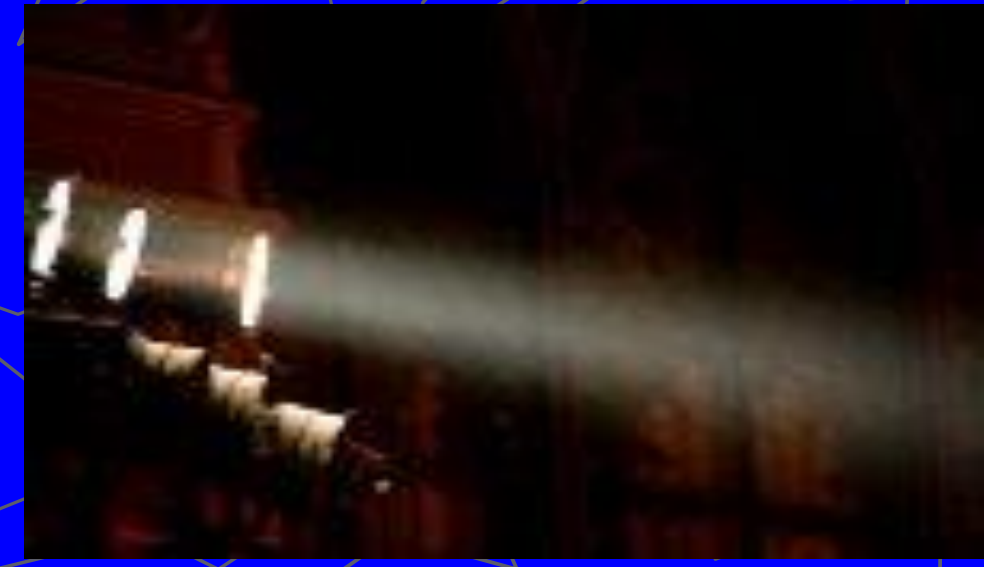
Пыль в доме