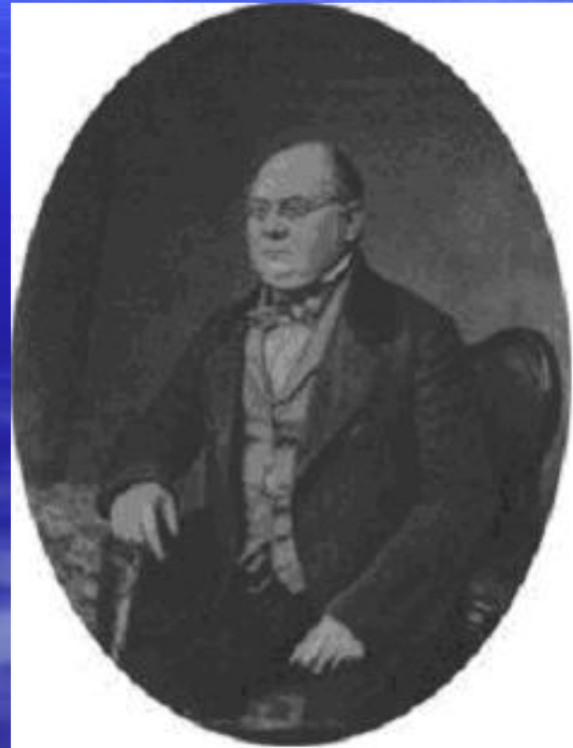
Н.И. Тютчев Фотография 1850-е гг.