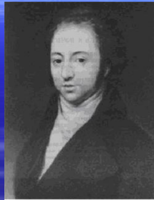
И.Н. Тютчев, отец поэта. Портрет работы Ф. Кюнеля 1801 г.

В объятых счастливой семьи Нежнейший муж , отец благотворитель, Друг истинный добра и бедных покровитель, Да в мире протекут драгие дни твои!