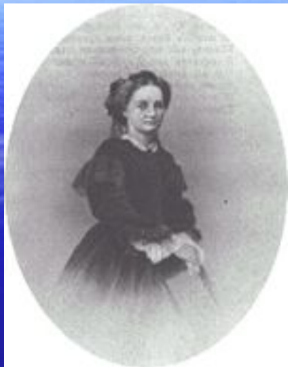
А.Ф. Тютчева (Аксакова), Фотография Деньера. 1864 г.