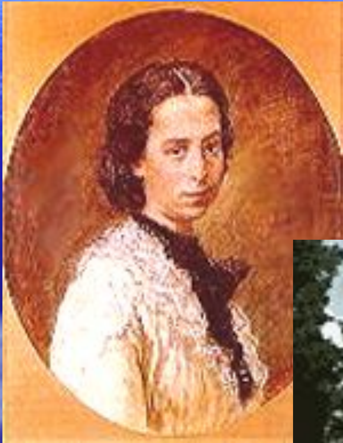
С портрета бр. Ткачевых

В родовом гнезде Тютчевых, селе Овстуг, в 1871 году Ф.И. Тютчева, Марией Бирилёвой, было основано первое в Брянском уезде училище для крестьянских Главный усадебный дом в