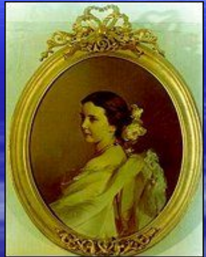
Дочь поэта. Кон.1840-х -нач 1850 гг.1850-е гг.

В своё время дочь поэта был увлечен Л.Н.Толстой и собирался на ней жениться. Однако позже писатель отказался от своего намерения, назвав Екатерину Федоровну «слишком оранжевым растением»