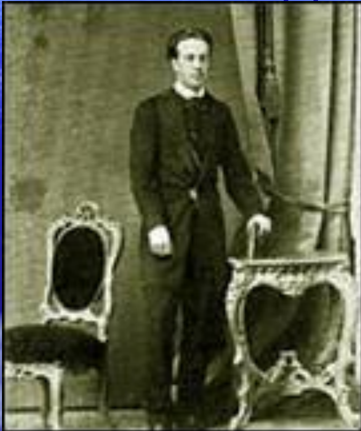
И.Ф.Тютчев Фотография 1868 г.