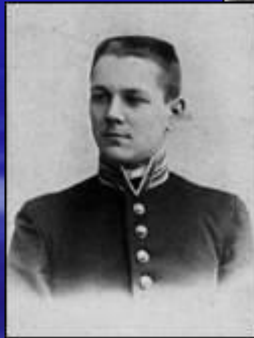
Н.И. Тютчев