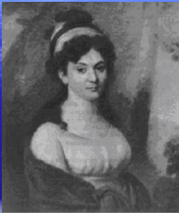
Е.Л. Тютчева, урождённая Толстая, мать поэта Портрет работы неизвестного художника Начало 19 века