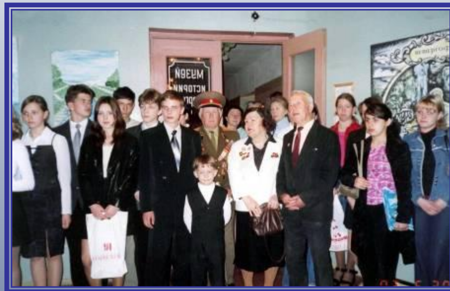
Открытие школьного музея.