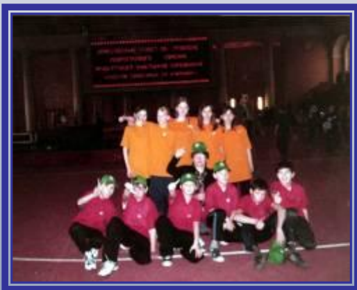
Городская акция: «Класс против курения».