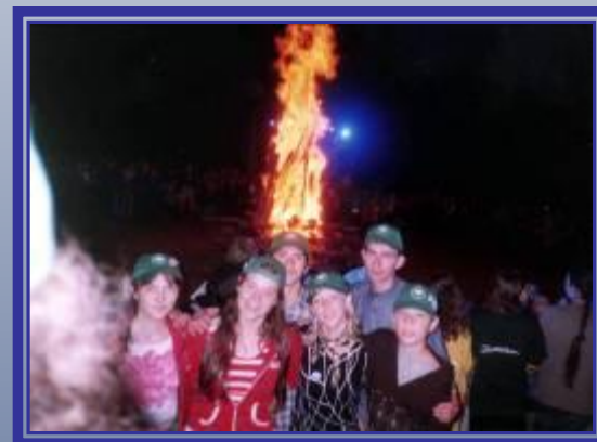
Школа присоединилась к движению детского общественного объединения «Союз юных петербуржцев».