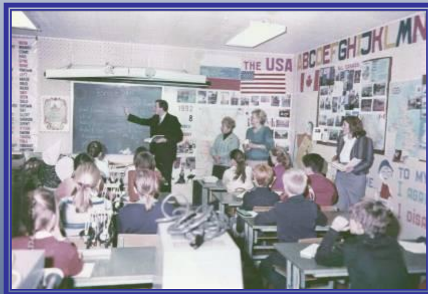
Праздничный вечер в 6 «б»классе.