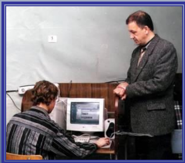
Мы осваиваем компьютеры.