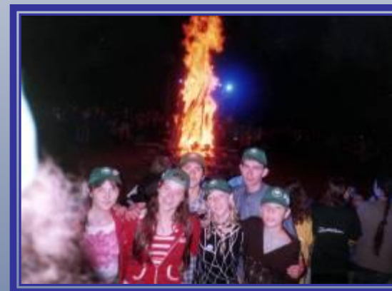
Школа присоединилась к движению детского общественного объединения «Союз юных петербуржцев».