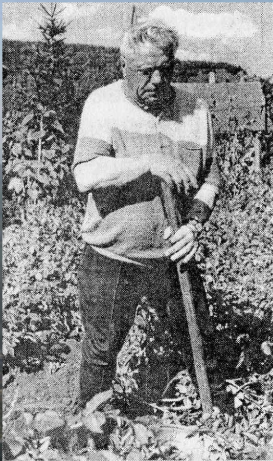
В.П. Астафьев на своем огороде