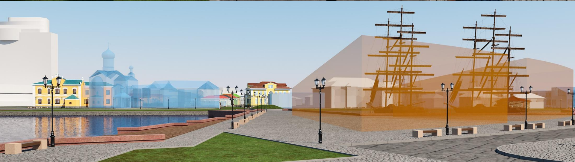
3-D модели квартала исторический застройки