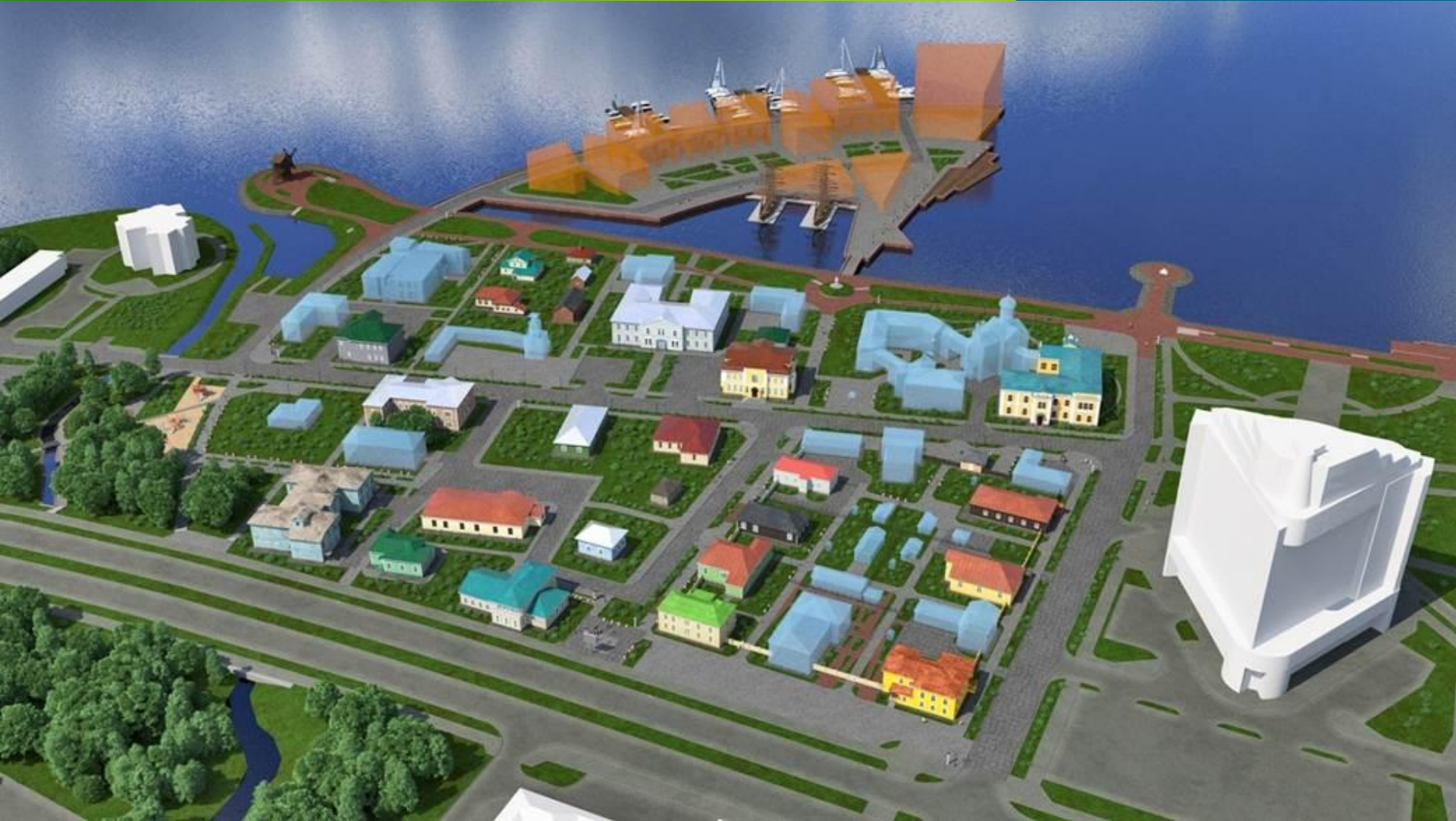
Вариант реконструкции квартала исторической застройки