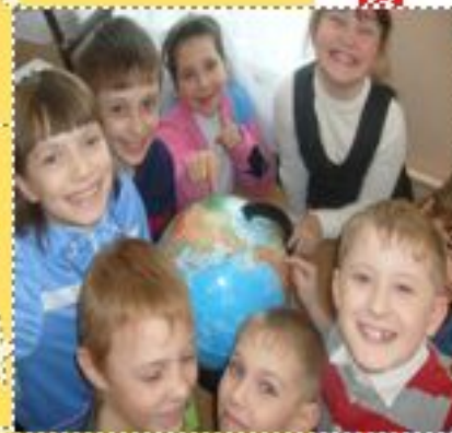
Да се радуем.