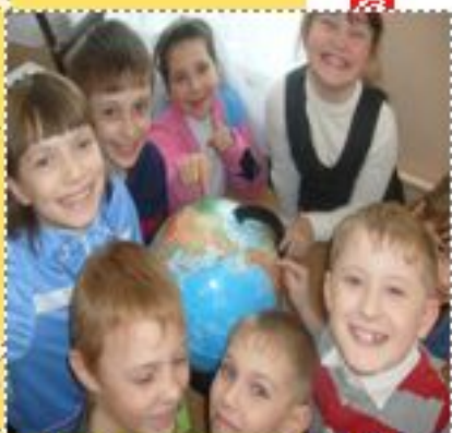
Да се играме.