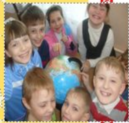
Да се радуем.