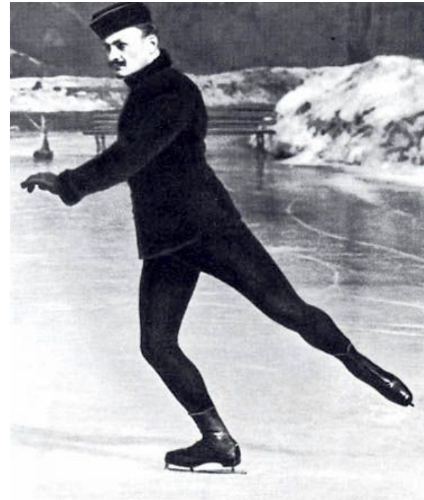
Первый российский Олимпийский чемпион - Николай Панин-Коломенкин