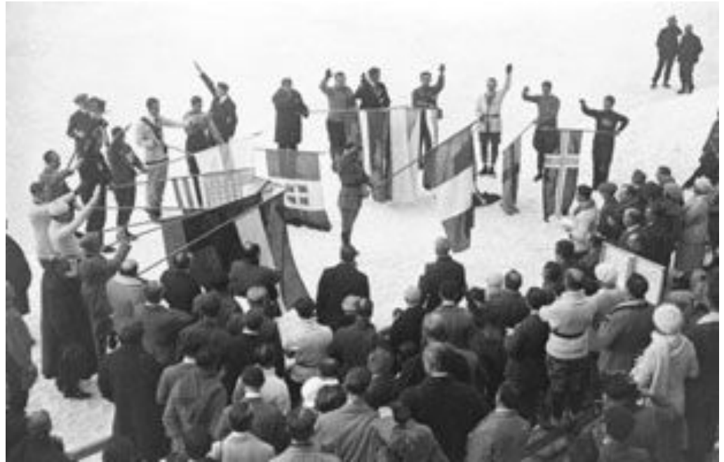
Торжественная церемония открытия первых зимних Олимпийских игр в Шамони.