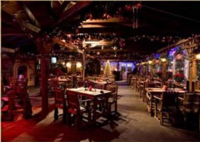
Ресторан «Дикий Койот»