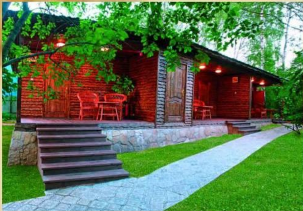
Гостевые домики в парковой зоне Клуба