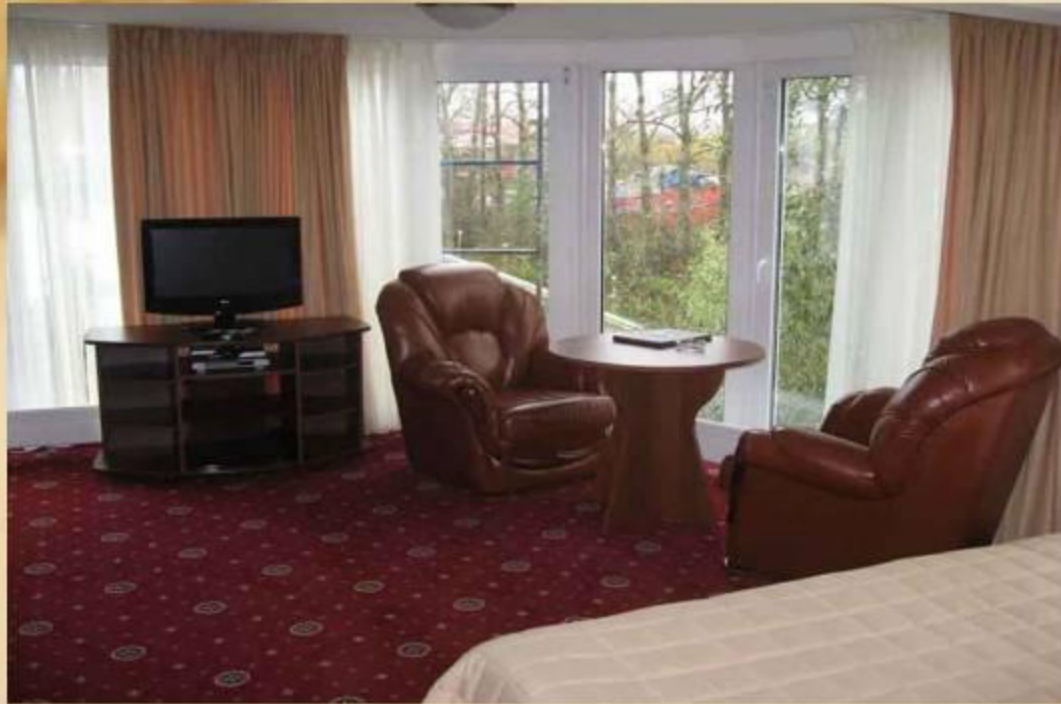
Номера на корабле «Адмирал»