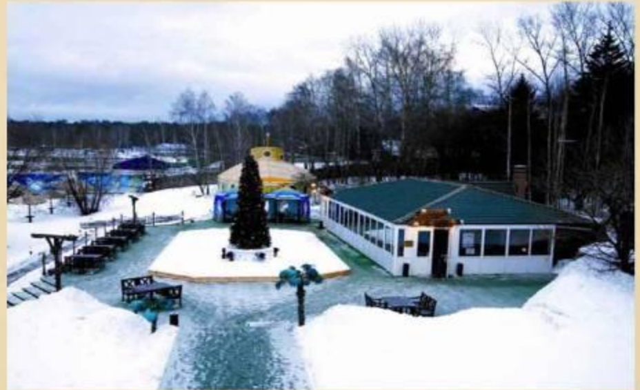
Ресторан «Флотель» (до 30 человек)