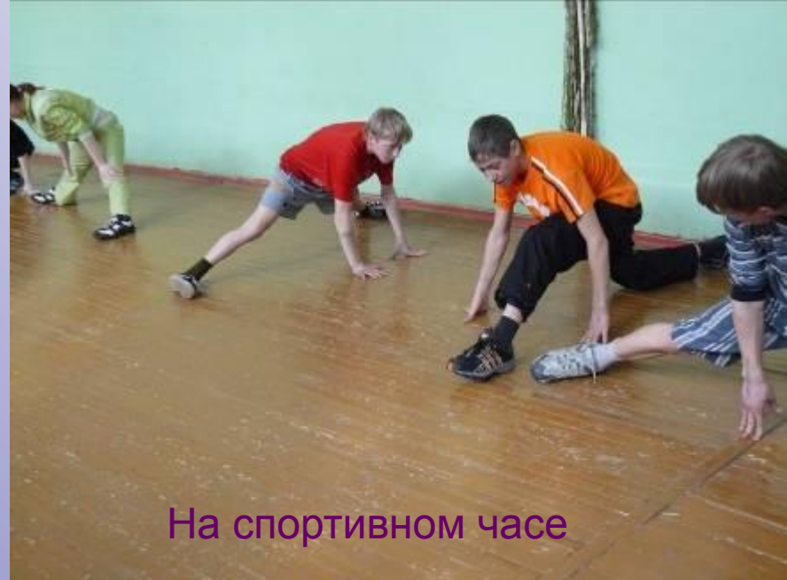
На спортивном часе