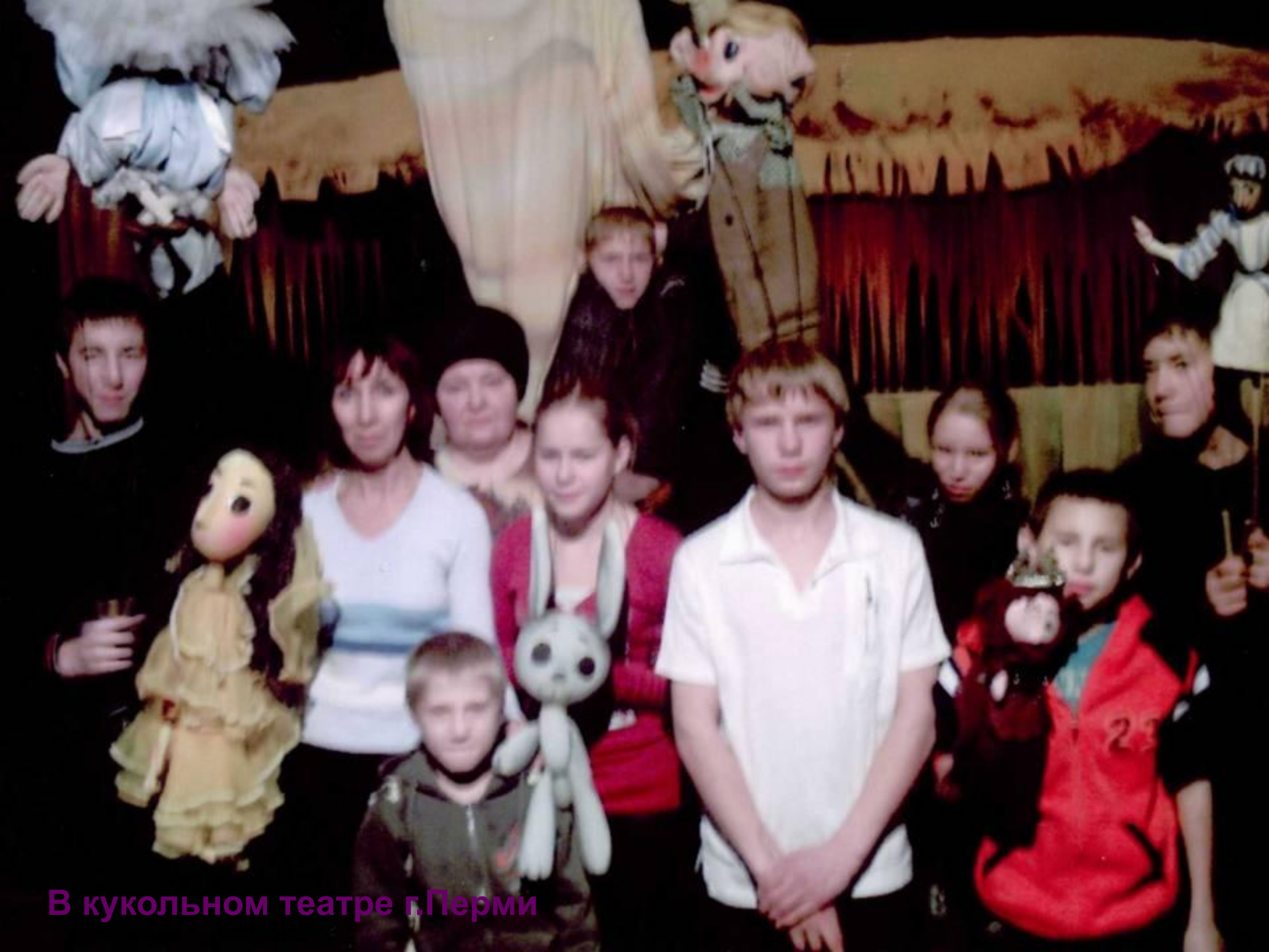
В кукольном театре г.Перми