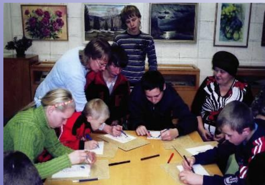
В районном музее им.М.Старостина