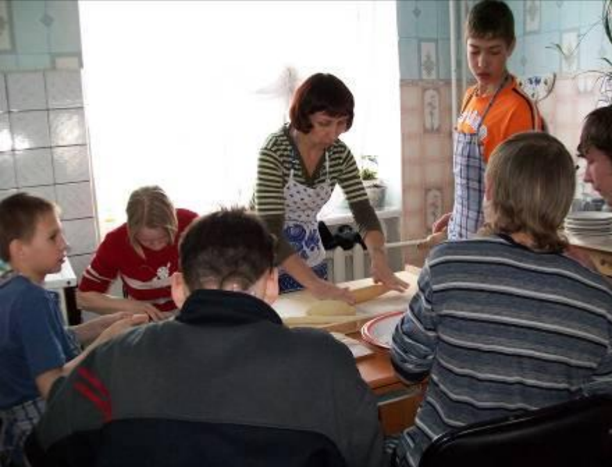
Занятие клуба «Хозяюшка»