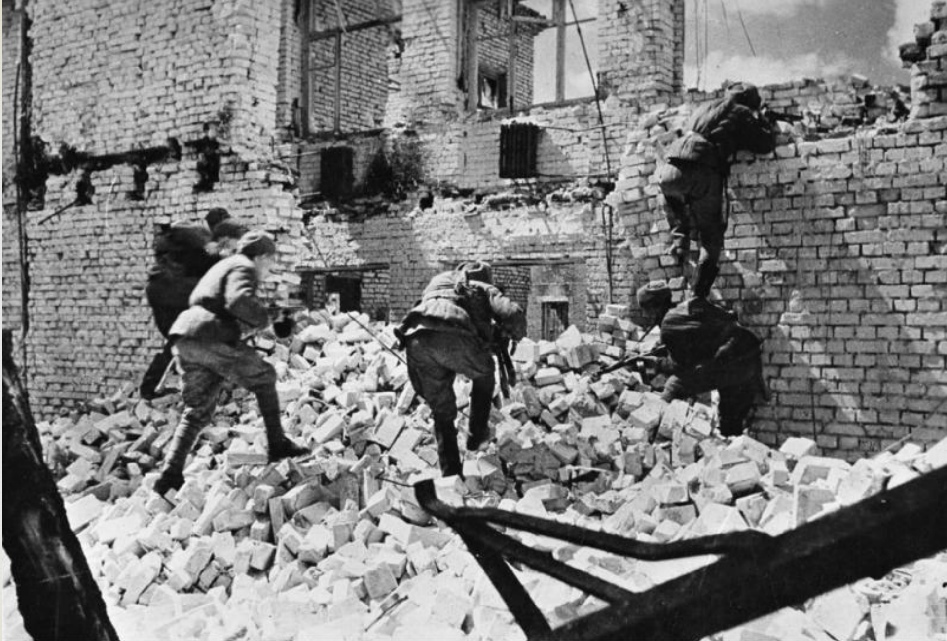
Bundesarchiv, Bild 183-R74190 Foto: o. Ang. | 1942