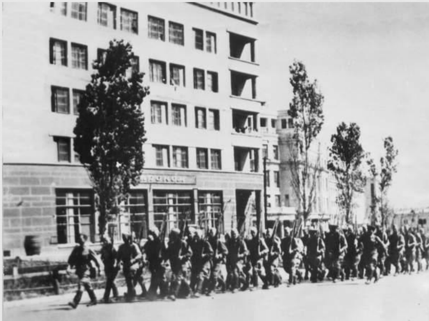
Сталинград в августе 1942 года