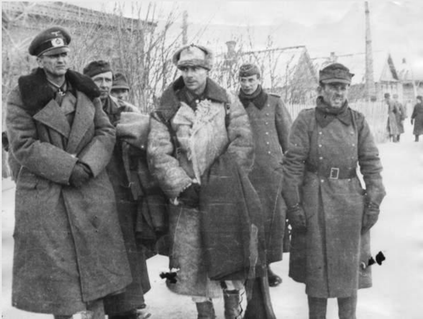
Сражение проиграно. Офицеры штаба Ф. Паулюса