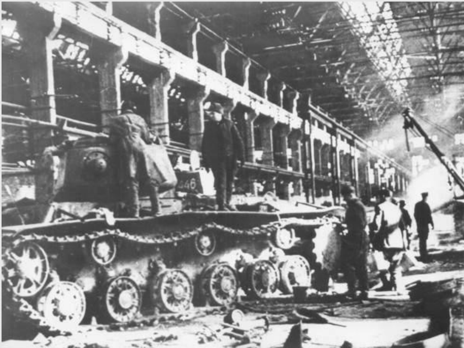
Ремонт боевой техники на Сталинградском тракторном заводе