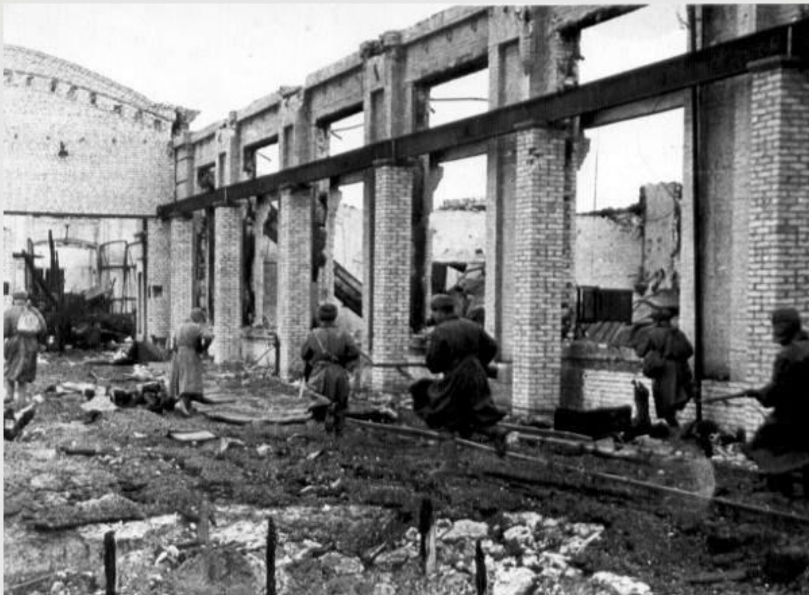
Бои на территории завода "Красный Октябрь"