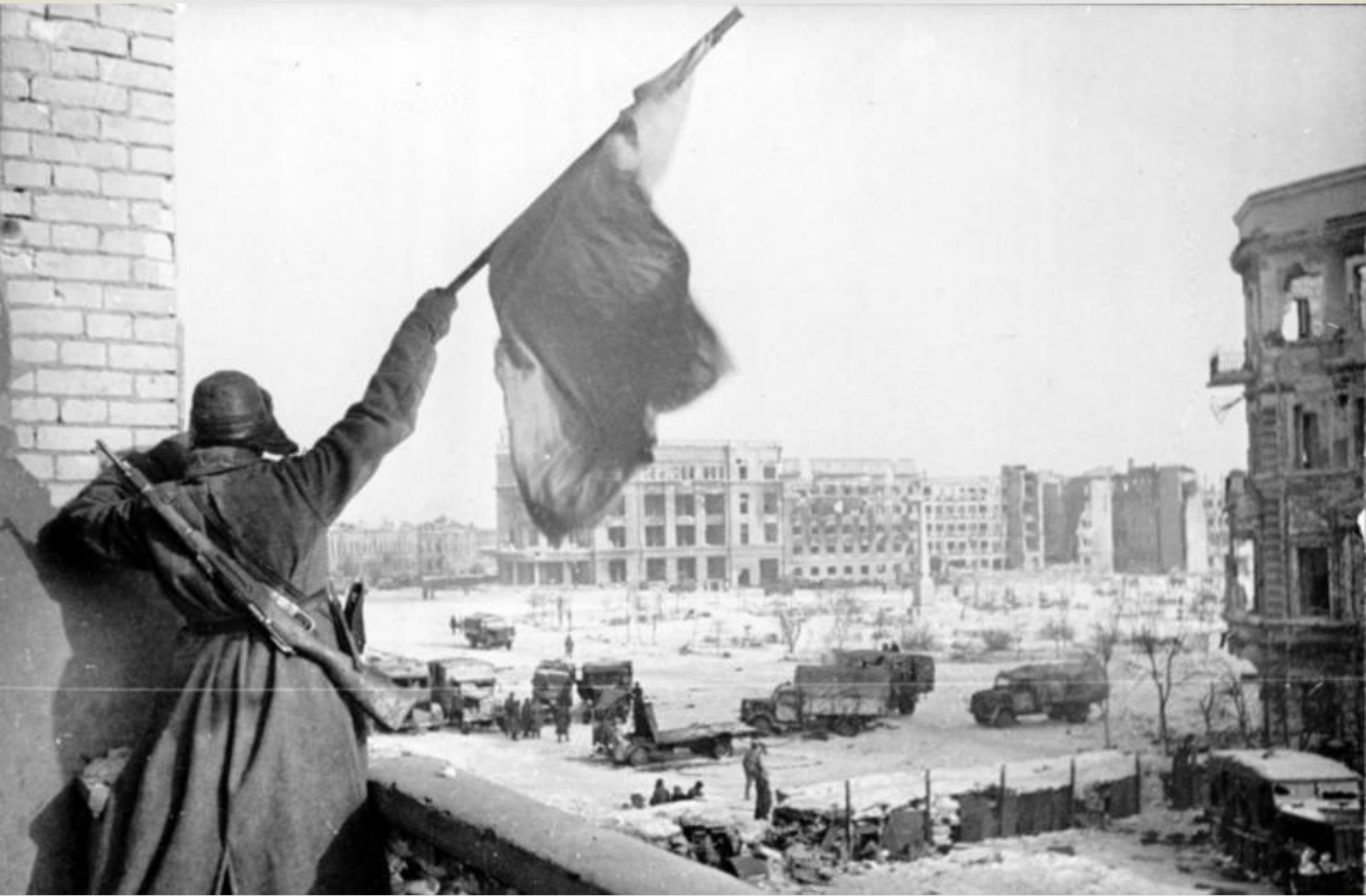
Советский флаг над освобождённым Сталинградом. Февраль 1943