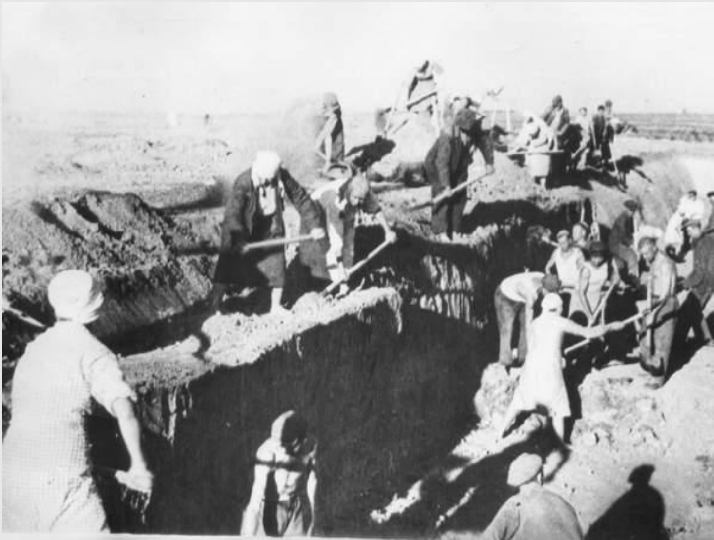
Жители города на строительстве оборонительных сооружений