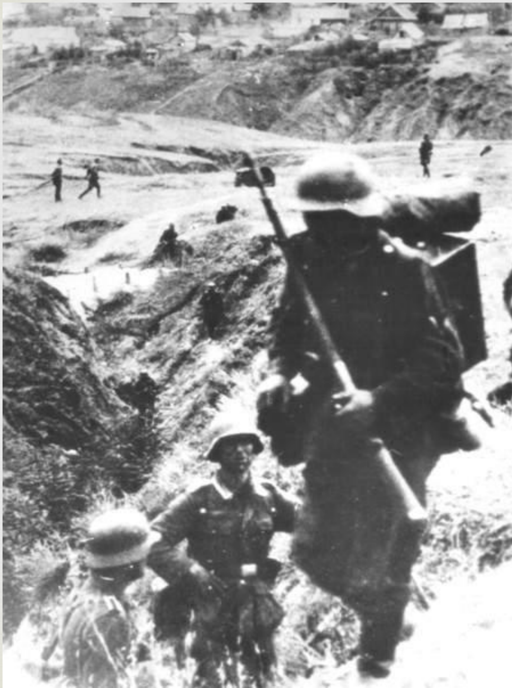
Части вермахта в районе Мамаева кургана. После первой атаки.