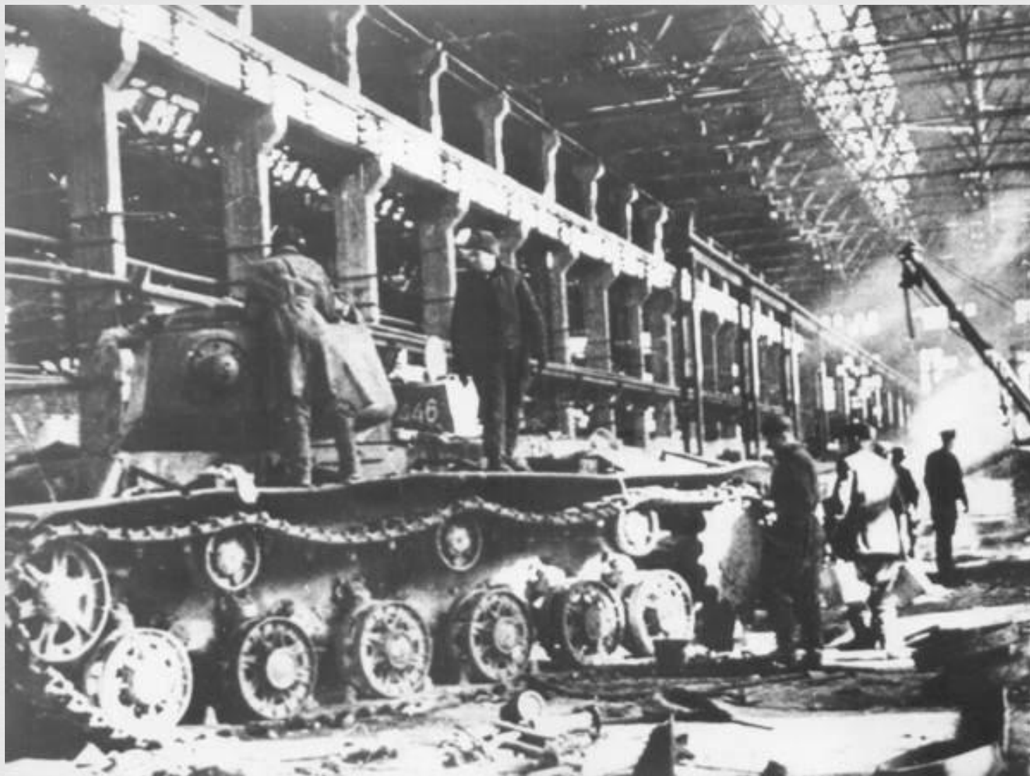
Ремонт боевой техники на Сталинградском тракторном заводе