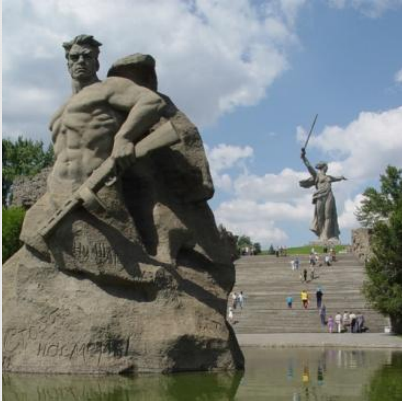
Историко-мемориальный комплекс «Мамаев курган»