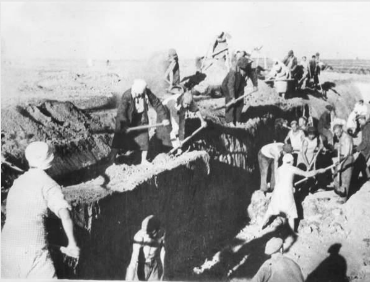
Жители города на строительстве оборонительных сооружений