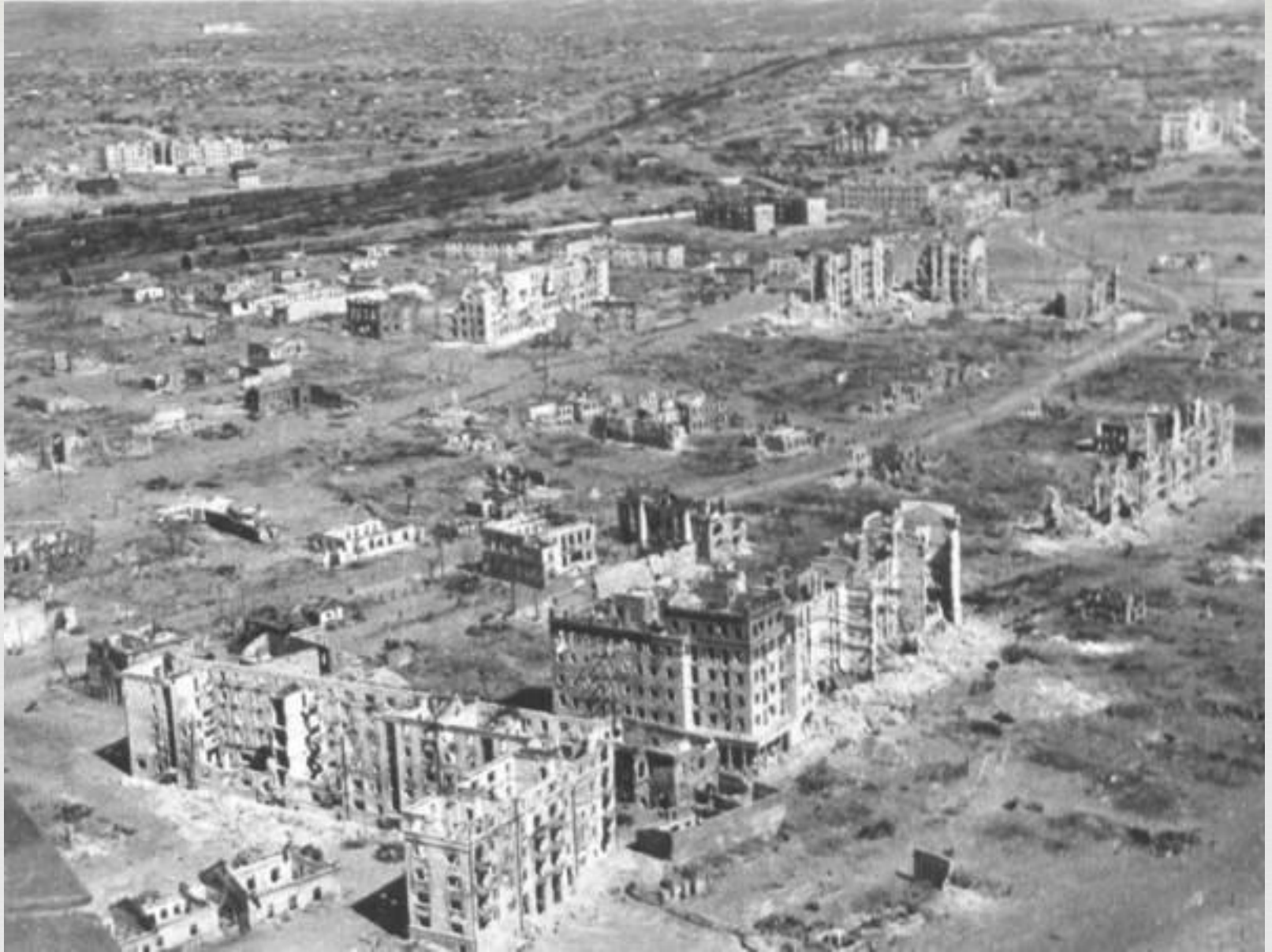
Панорама разрушенного Сталинграда