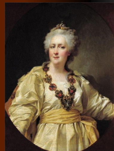
Императрица Екатерина II