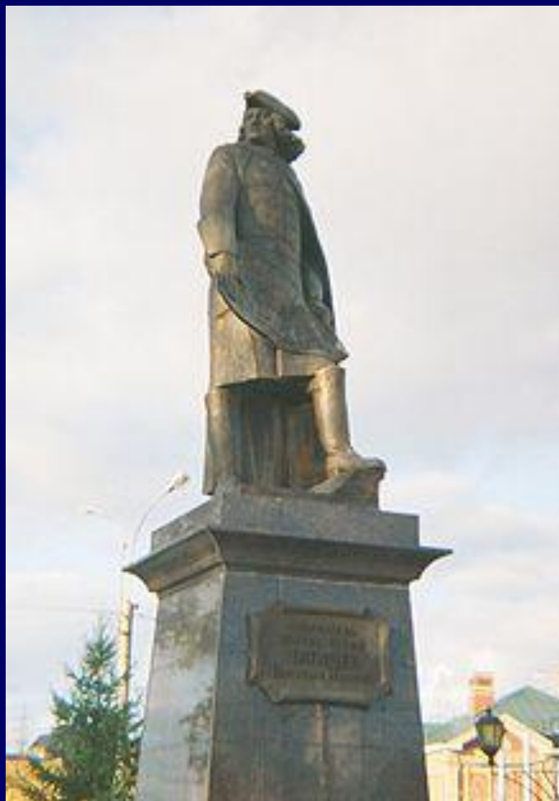
Памятник В. Н. Татищеву в Перми