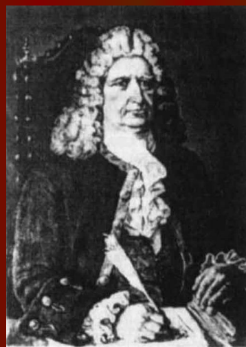
Герард Фридрих Миллер