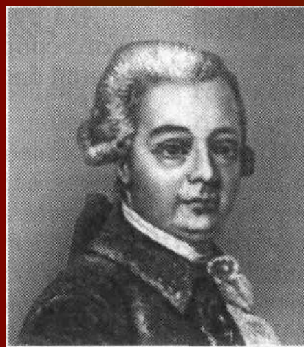
Иван Никитич Болтин