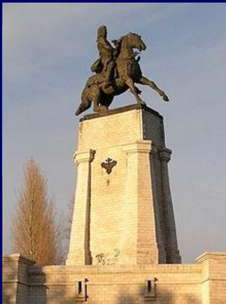
Памятник В. Н. Татищеву в Тольятти