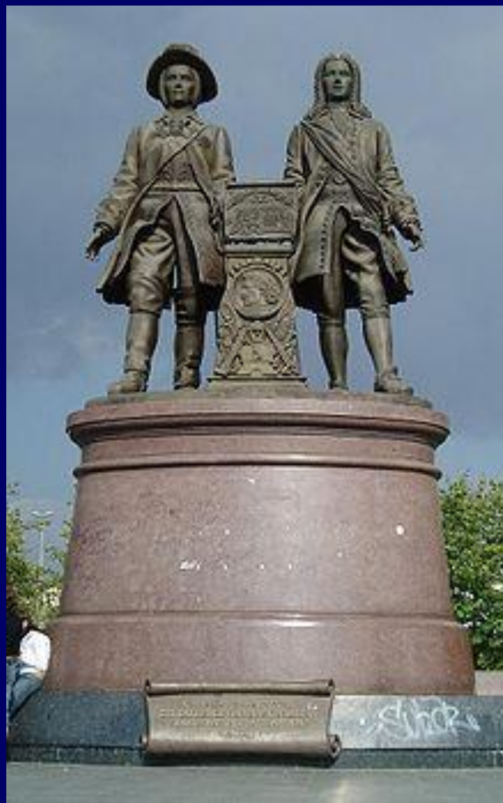
Памятник Татищеву и Вильгельму де Генину в Екатеринбурге