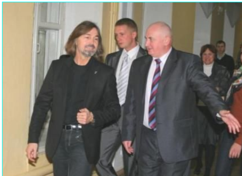
Художник Никас Сафронов в стенах академии