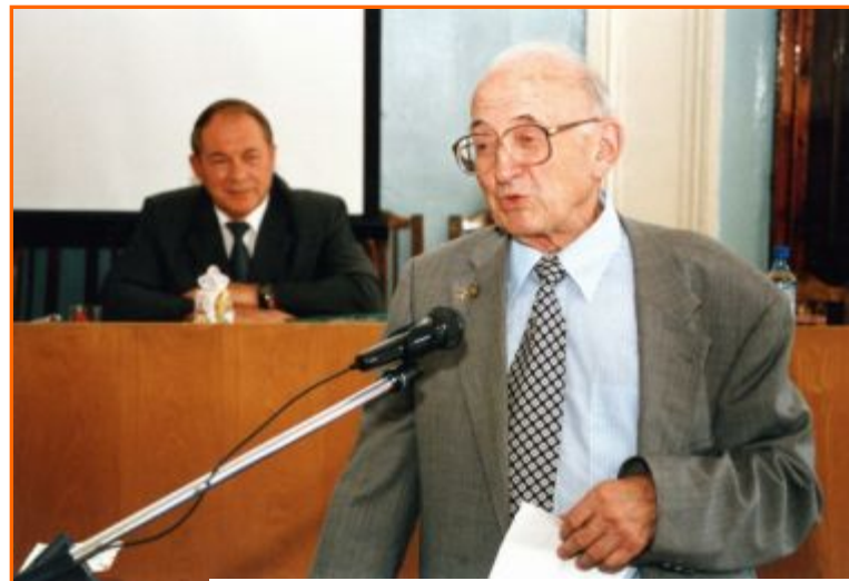
Выпускник ЯМИ 1946 г. академик РАМН М.И.Перельман