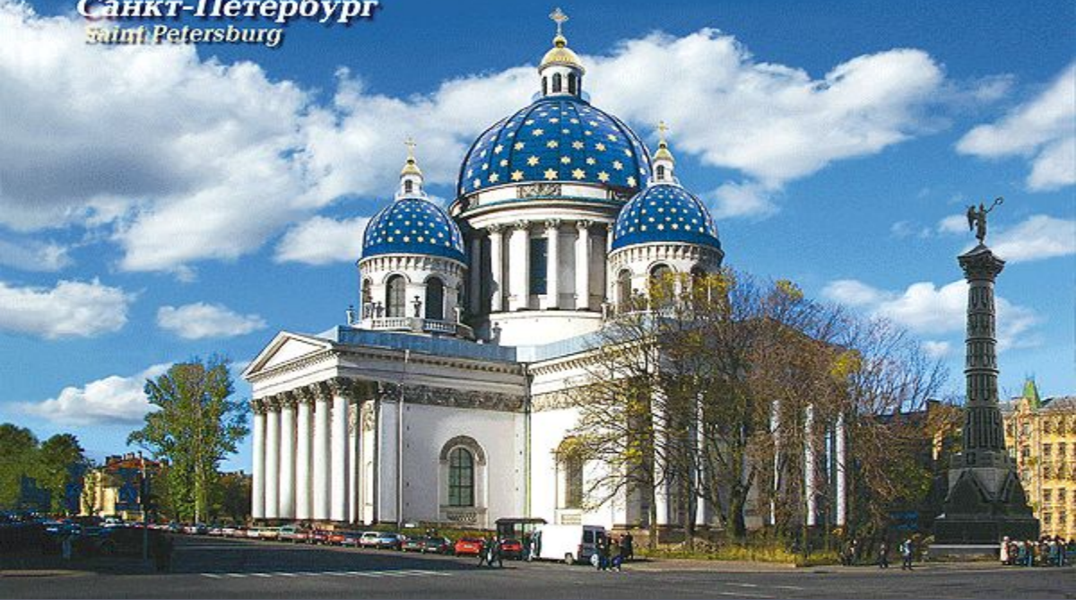
Санкт-Петербург Saint Petersburg