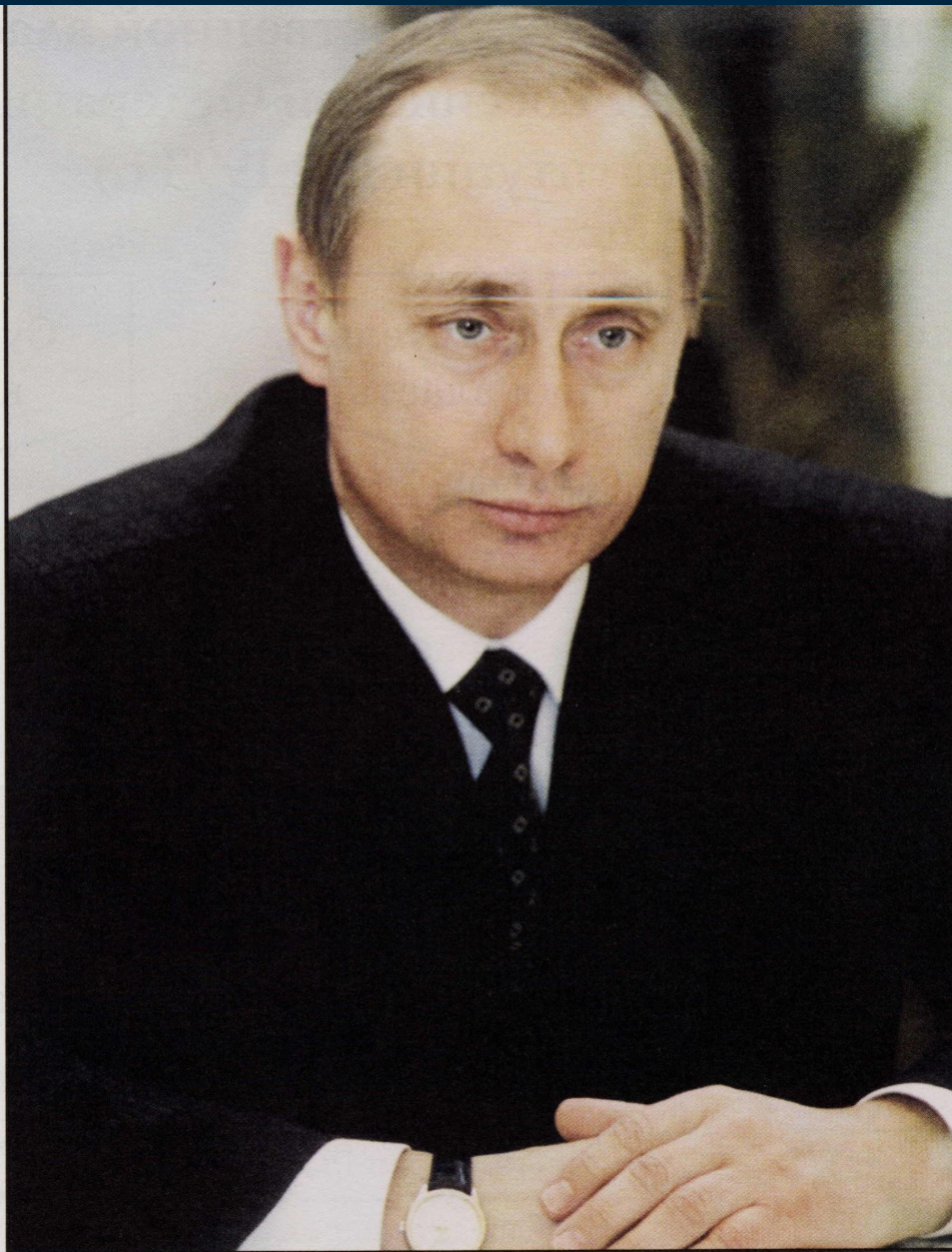
В. В. Путин, Президент Российской Федерации