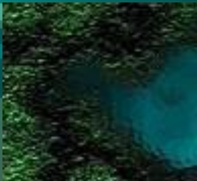
На дне Океана