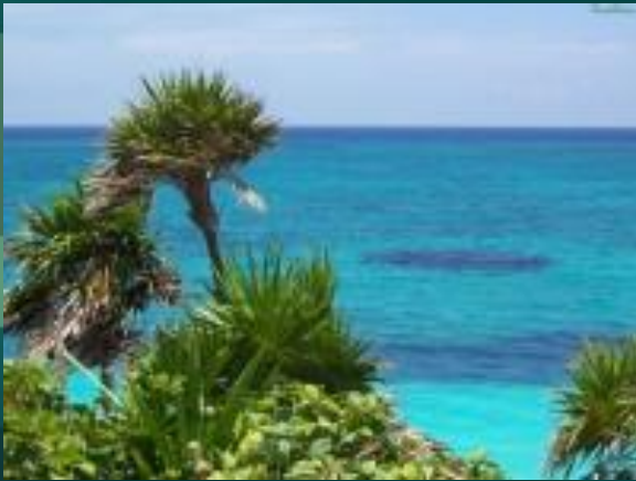
Остров Мадагаскар, Индийский Океан

Это огромная экосистема, условно разделенная на связанные между собой части: Атлантический, Тихий, Индийский и Северный Ледовитый океаны.