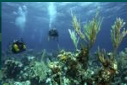
На дне океана

В тропиках лучи солнца попадают в воду почти под прямым углом и проникают на глубину 200-250 м. Ближе к полюсам они скользят по поверхности воды и проникают на гораздо меньшую глубину. Поэтому зона фотосинтеза в тропиках гораздо разнообразнее. По мере удаления от суши живой мир океана также меняется.