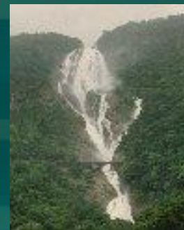
Поступление Воды В море