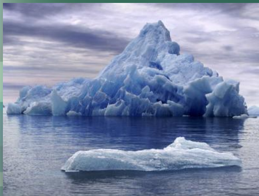
Материковый Водоем и Лед

Жизнь и вода тесно связаны. Предания многих народов говорят о том, что жизнь на Земле зародилась в воде. Водная оболочка земли, именуемая гидросферой, состоит из океанов, морей, материковых водоемов и льдов. На Мировой Океан приходится 71% поверхности земного шара. Этот огромный мир со своими обитателями живет по особым законам. Как и на суши, в океане есть свои горы, возвышенности, равнины, низменности и глубокие впадины.