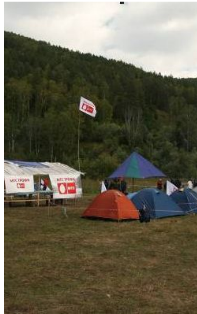
МТС-трофи – приключенческое мероприятие для команд со всей России