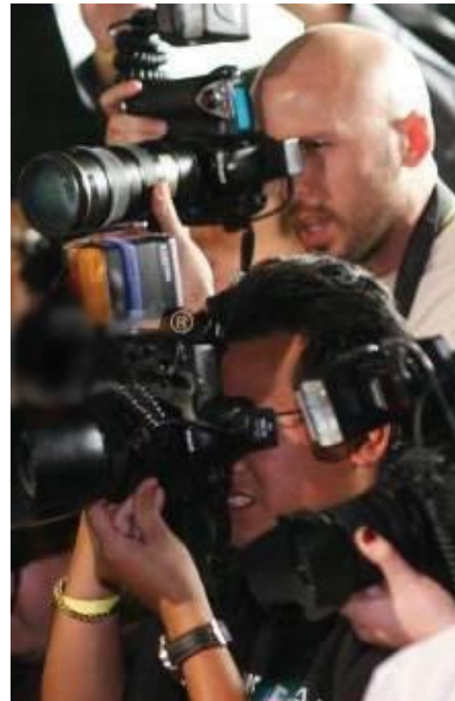
On-line конкурсы для сотрудников, например, конкурс на лучший сюжет для видео-ролика о компании