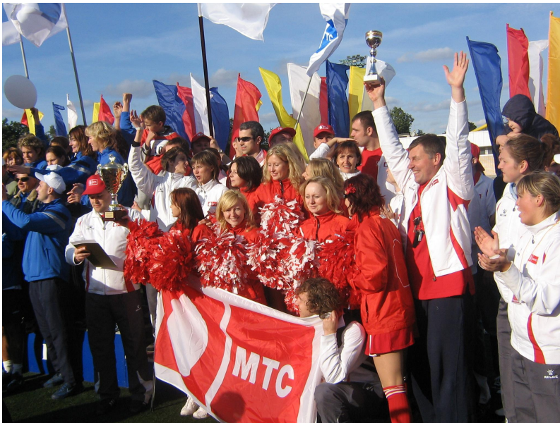
Спортивные мероприятия: Спартакиады, соревнования по лыжам и сноуборду, футболу, шахматам и др.