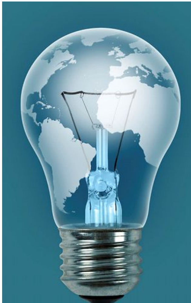
Фабрика идей – проект, направленный на поиск и реализацию новых идей