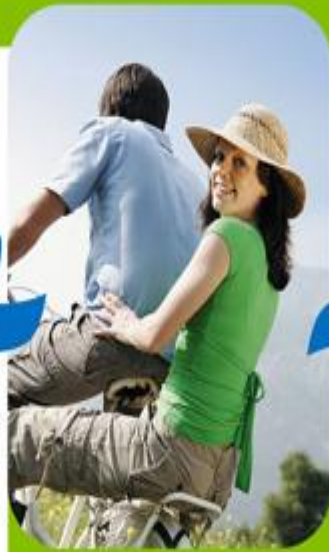
Активный образ жизни