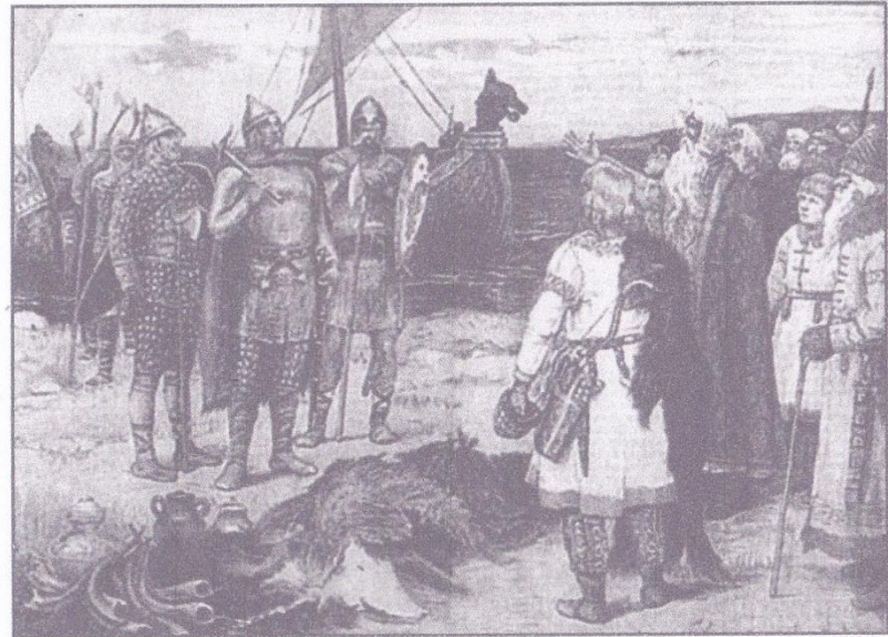
Варяги. Художник В. М. Васнецов