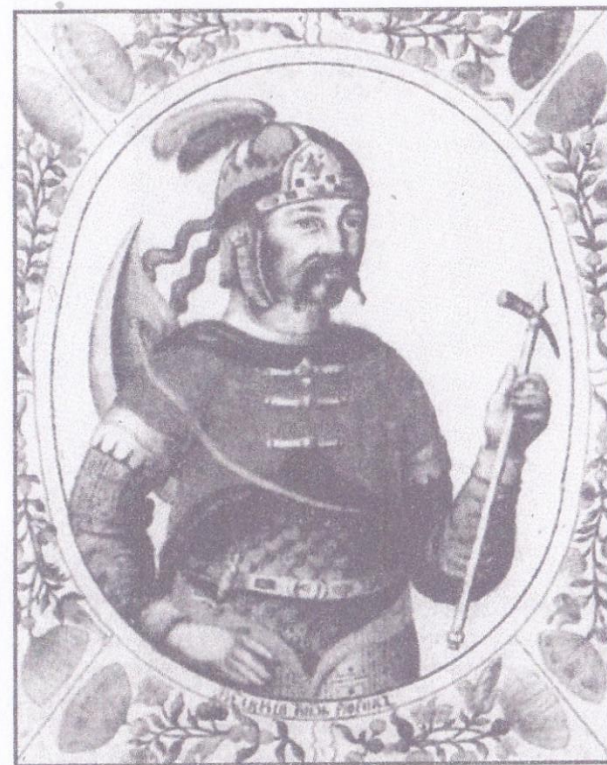
варяжский князь Рюрик

862 г. – летописное « призвание варягов » во главе с князем Рюриком в Новгородскую землю