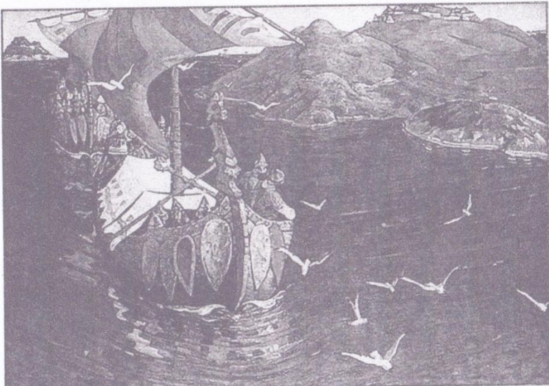
Заморские гости. Художник Н. Рерих