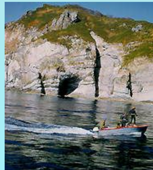
Река Лена в районе столбов