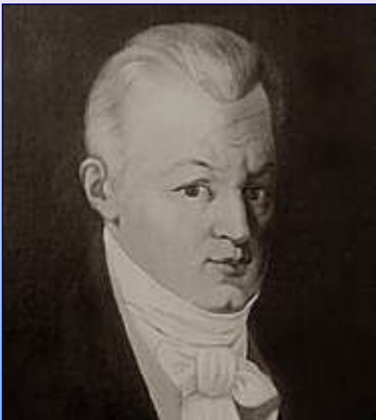
Александр Онисимович Аблесимов Первая комическая опера «Мельник – колдун, обманщик и сват»