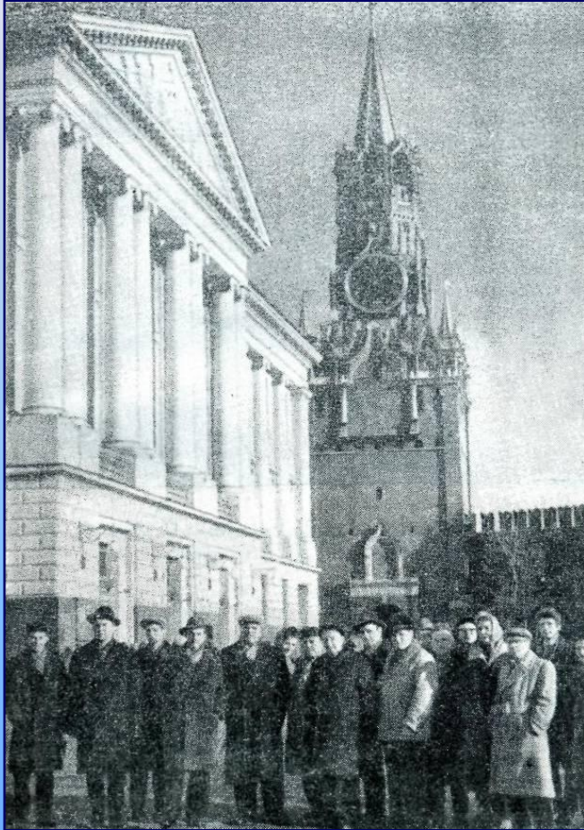
Участники спектакля «Финал»

Заслуженной творческой победы добился театр в работе над драмой П. Строгова «Финал», премьера которой состоялась 22 апреля 1962 года. Спектакль «Финал» в ленинские дни 1963 года показывался на сцене Кремлевского театра, транслировался по Центральному телевидению. Газета «Красная звезда» отмечала: «Костромичи показали сложное, многоплановое произведение, взявшись за тему, хотя и не новую, но вечно живую. Их смелые поиски, большой кропотливый труд, вложенный в спектакль, заслуживает большого уважения»