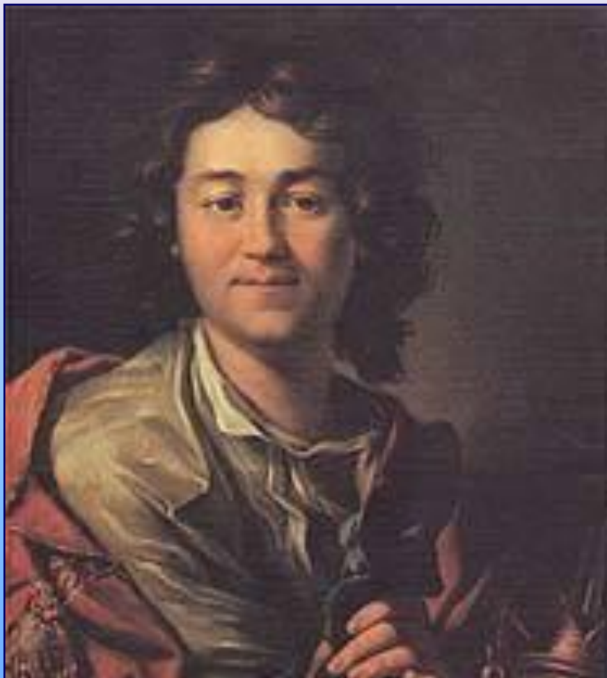
Федор Григорьевич Волков

Создатель первого в России профессионального общедоступного театра Федор Григорьевич Волков (1728-1763). И совсем неважно (документально не подтверждено), показывал ли он со своей ярославской труппой первые спектакли в Костроме, с которой его связывали родственные связи. Важно, что за ним пошли костромичи, ставшие в конце XVIII – начале XIX столетия видными драматургами, выдающимися актерами столичной сцены