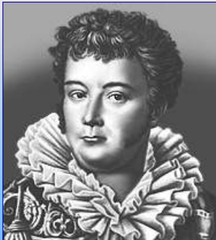
На всю Россию в начале 19 века гремело имя А.С. Яковлева