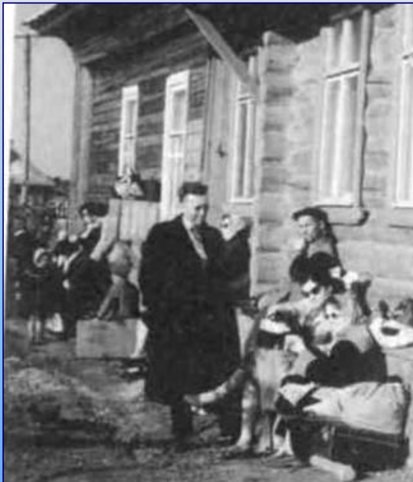
Артисты Костромского драматического театра на гастролях

Театр часто выезжает в рабочие и сельские клубы, приобщая к искусству широкие трудящиеся массы