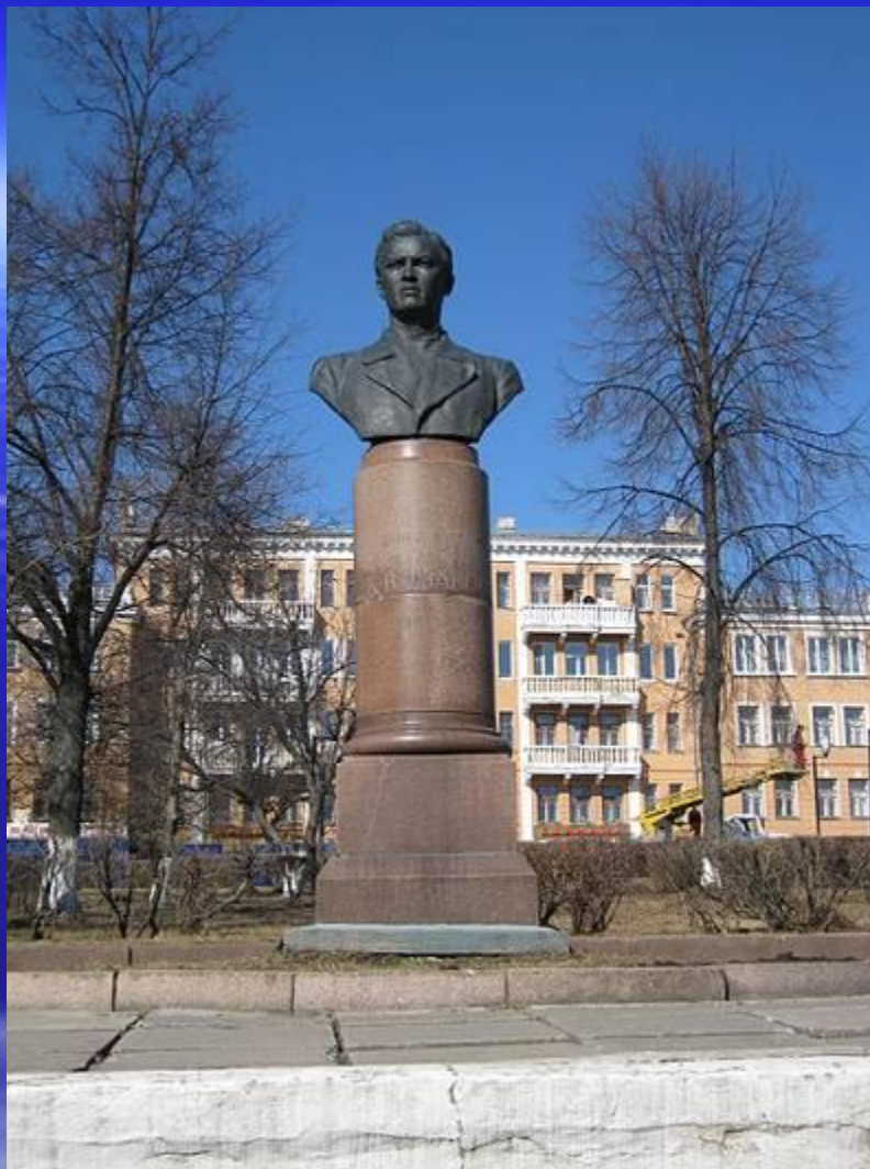
Памятник К.В.Иванову на Красной площади в Чебоксарах