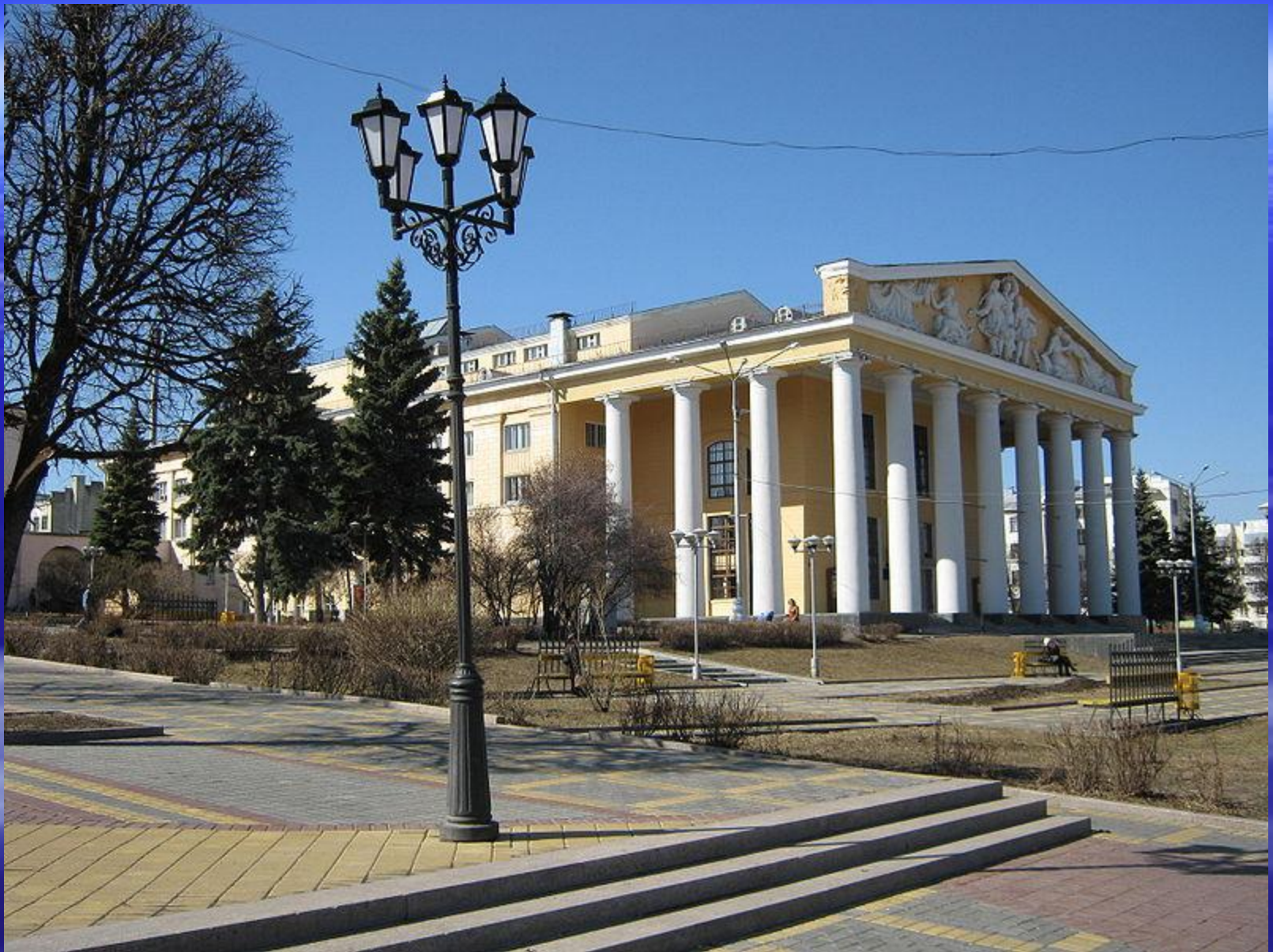
Чувашский академический театр драмы имени К.В.Иванова