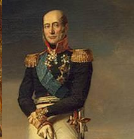
Барклай-де-Толли М. Б.