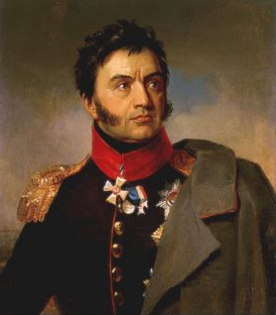
Раевский Н. Н.