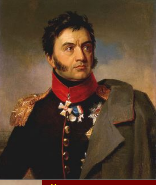
Раевский Н. Н.