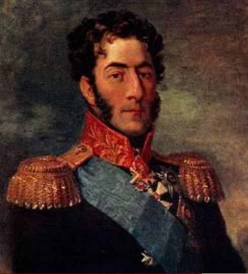
Багратион П. И.