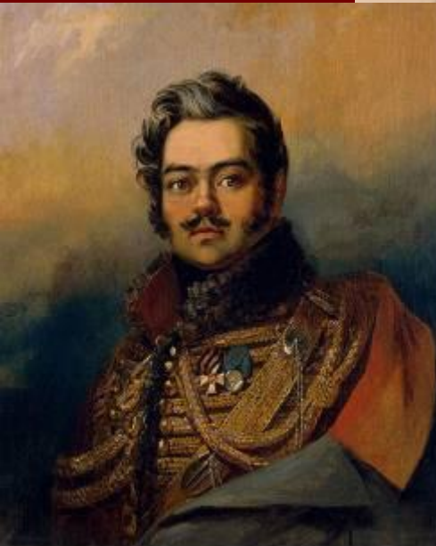
Давыдов Д. В.