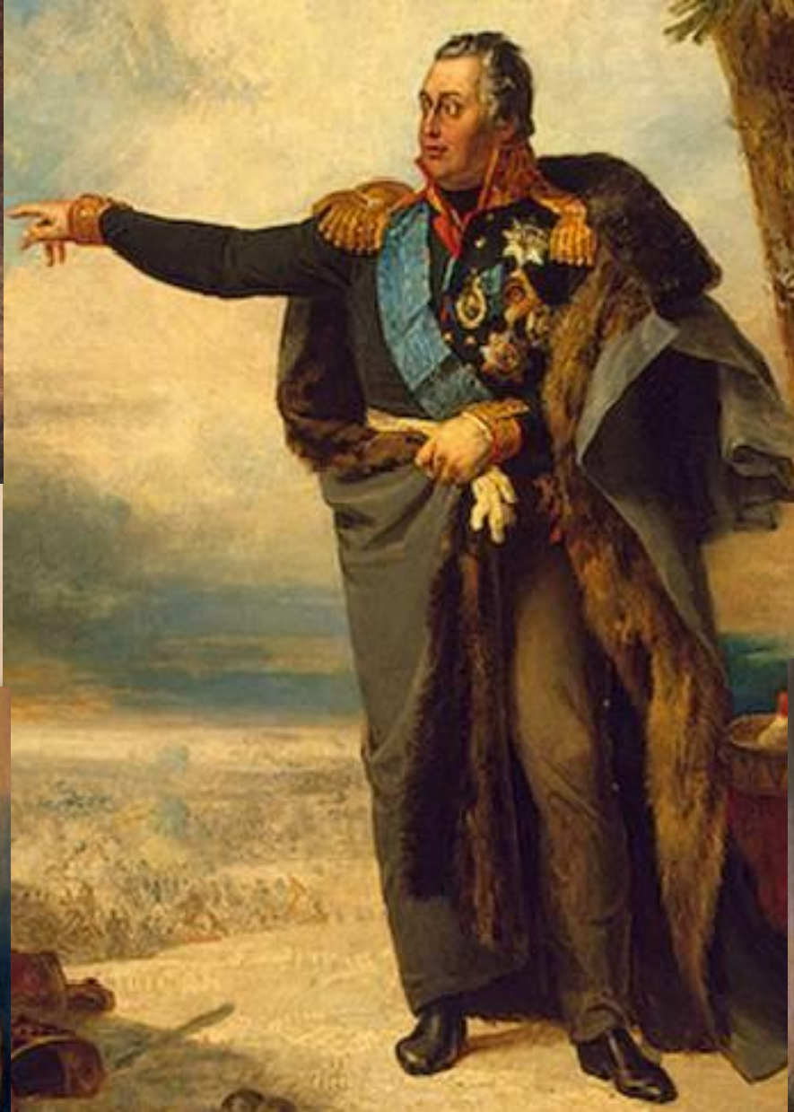
Кутузов М. И.