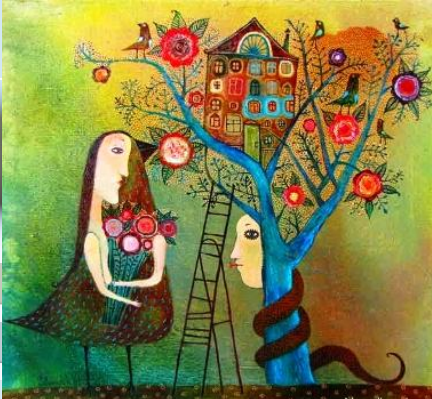
Худ. Анна Силивончик