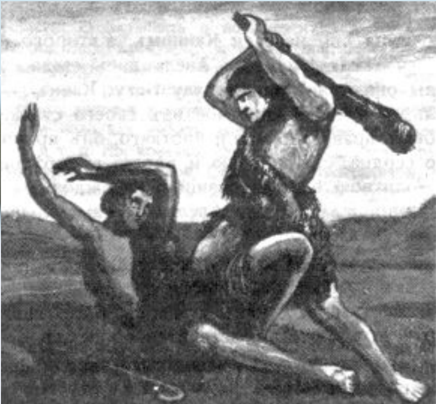
Каин убивает Авеля