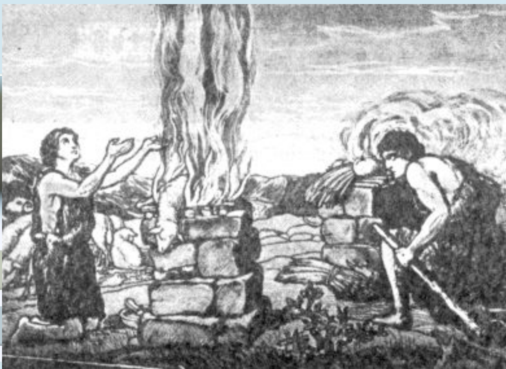
Каин и Авель. Авель приносит жертву Богу