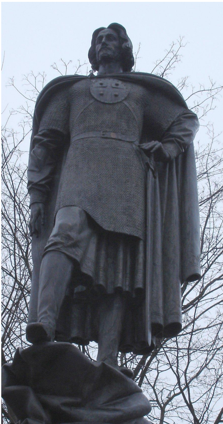
Памятник Александрю Невскому в Санкт - Петербурге