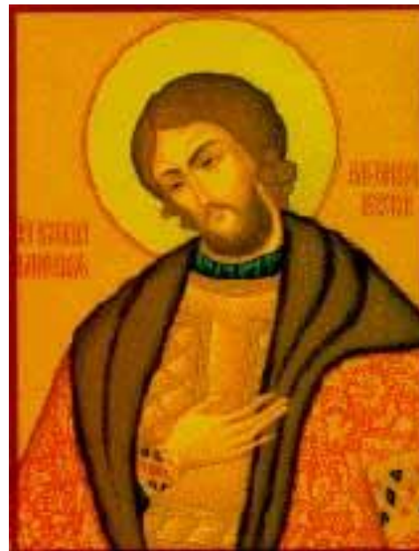
Икона Александра Невского

Уже в 1280-х годах во Владимире начинается почитание Александра Невского как святого, позднее он был официально канонизирован Русской православной церковью. Александр Невский был единственным православным светским правителем не только на Руси, но и во всей Европе, который не пошел на компромисс с католической церковью ради сохранения власти.