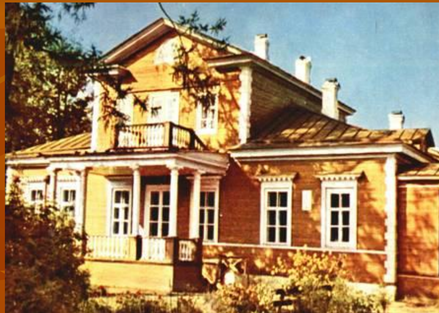
Дом Пушкина .Болдино.