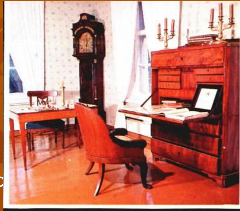
Рабочий стол поэта

Во второй раз Пушкин посетил Болдино в октябре 1833, возвращаясь из поездки по Уралу, где собирал материал по истории пугачевского восстания. О своей жизни в этот период он писал жене: «Просыпаюсь в семь часов, пью кофей и лежу до трех часов. Недавно расписался и уже написал пропасть. В три часа сажусь верхом, в пять в ванну и потом обедаю картофелем да гречневой кашей. До девяти часов — читаю. Вот тебе мой день, а все на одно лицо» (30 октября 1833).