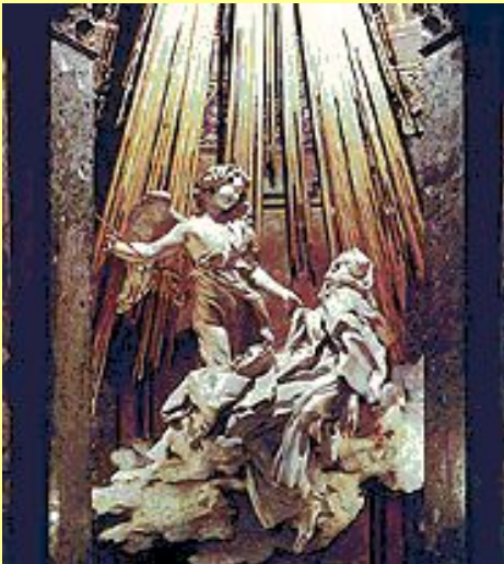
Лоренцо Бернини. Экстаз Св. Терезы.