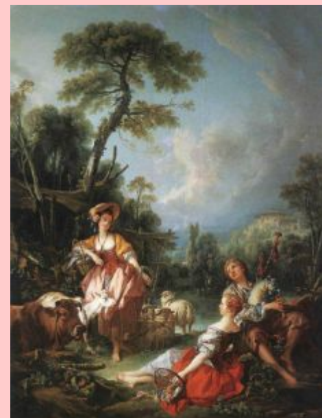
Ф.Буше. Летняя пастораль