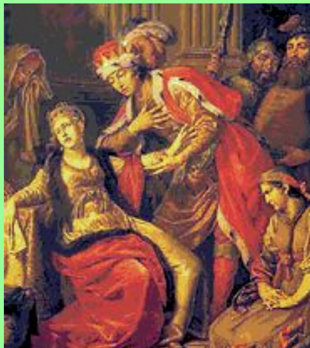
Лосенко А.П. Владимир перед Рогнедой 1770