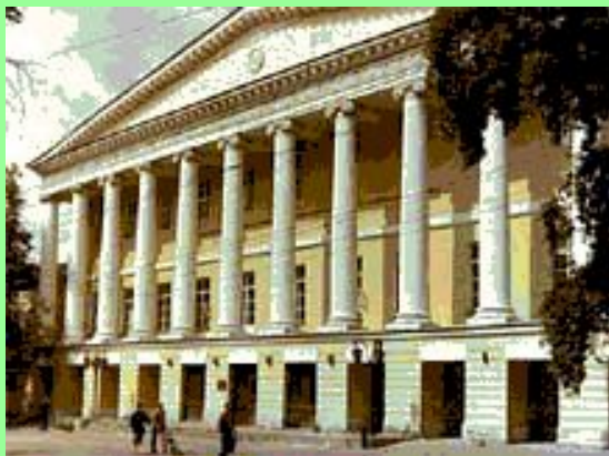
М.Ф.Казков. Екатерининская больница. 1786-1790. Москва