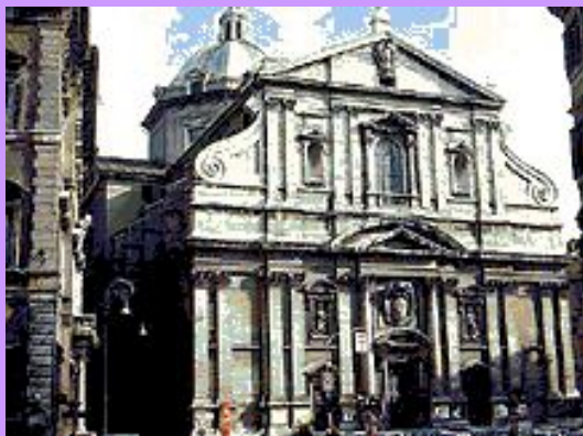
Джакомо Делла Порта. Церковь Иль Джезу. 1575. Рим