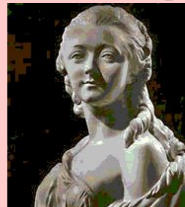
Ог. Пажу. Мари Жанна Дюбарри. 1730-1809