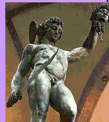
Бенвенуто Челлини. Персей. 1545-1554. Флоренция