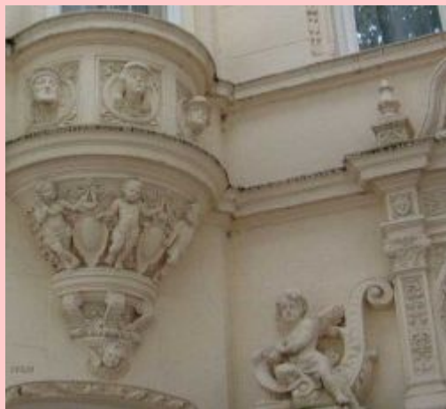
Элементы архитектурного декора