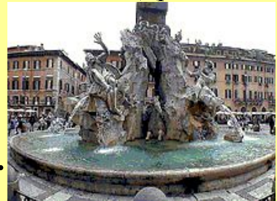
Лоренцо Бернини. Фонтан четырёх рек на площади Навона.