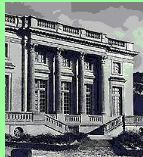
Ж.А.Габриель. Малый Трианон. 1762-1764. Версаль