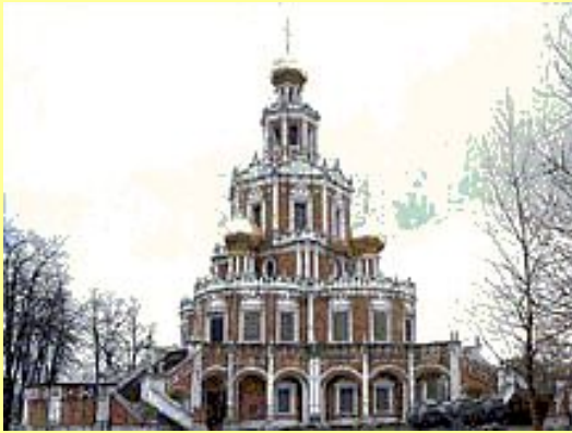
Церковь Покрова в Филях.