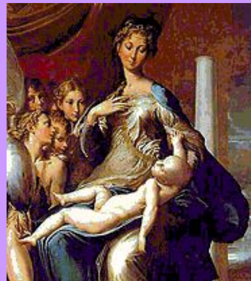
Фр. Пирмиджанино. Мадонна с длинной шеей. 1534-1540. Питти. Флоренция