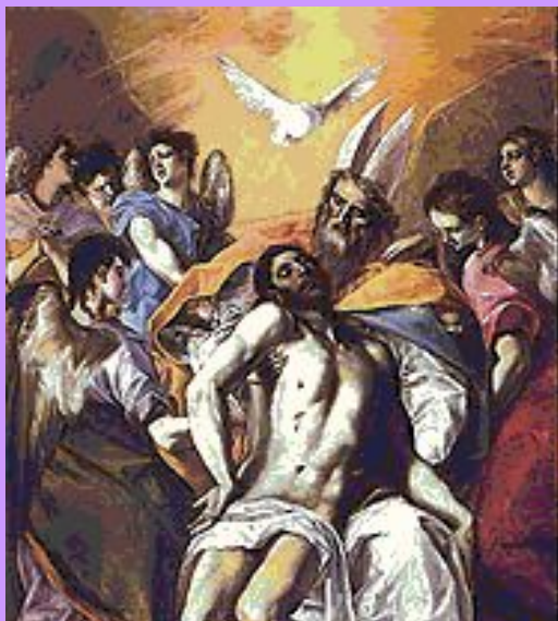
Эль Греко. «Троица». 1577-1579. Прадо. Мадрид