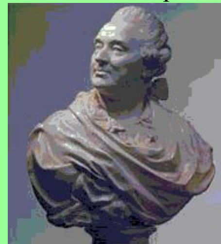
Шубин Ф. Бюст князя А.М.Голицина. 1773. Москва