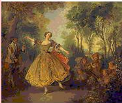
Н.Ланкре. Танцовщица Камарго. Эрмитаж