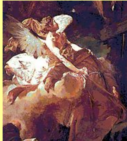
Дж. Батиста Пьяцетта. Экстаз Св. Франциска.