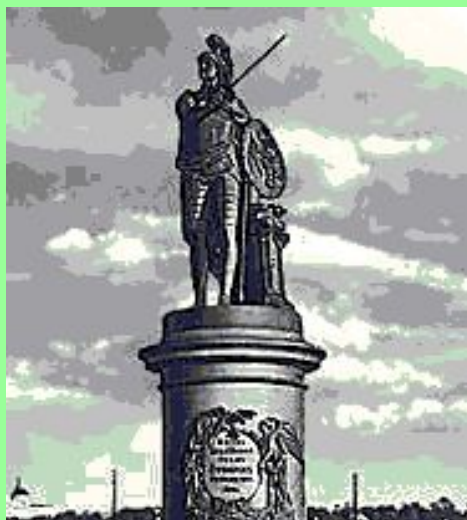
Козловский М.И. Памятник А.В.Суворову. 1799-1801. С.-Петербург