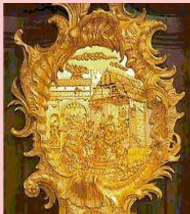
Фрагмент мебели из Зимнего дворца. Санкт-Петербург