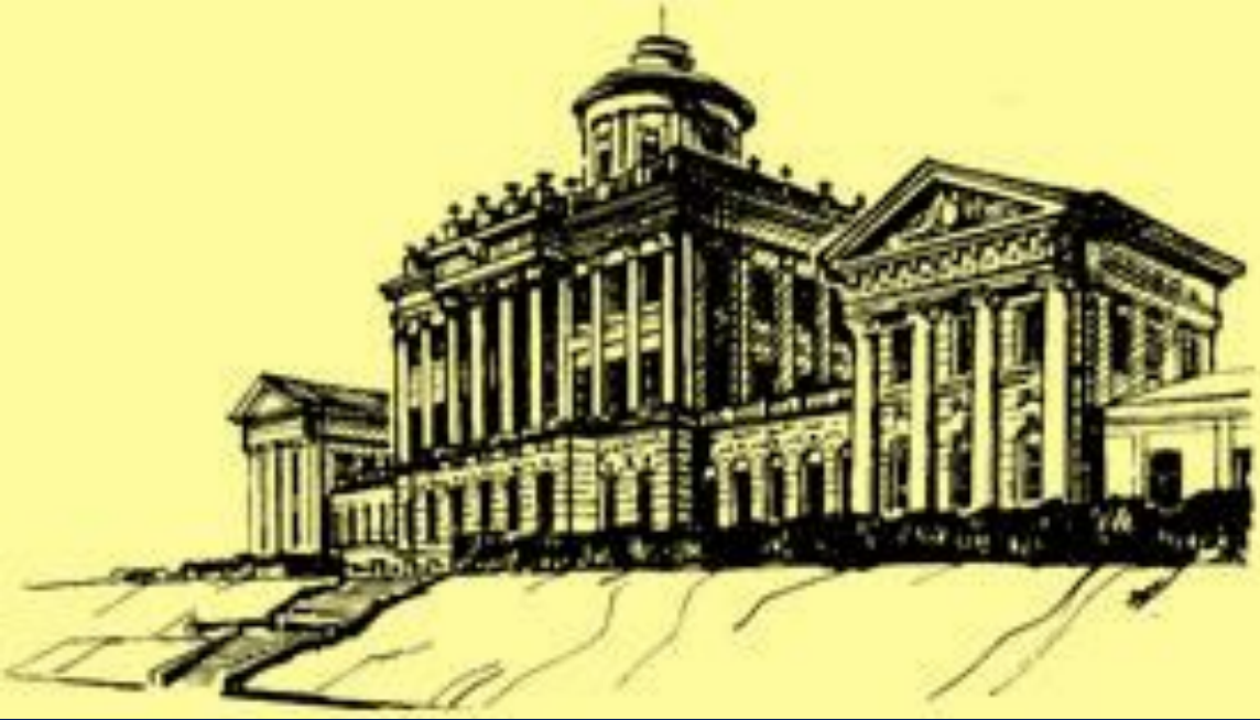
Москва. Дом Пашкова. 1780 г.