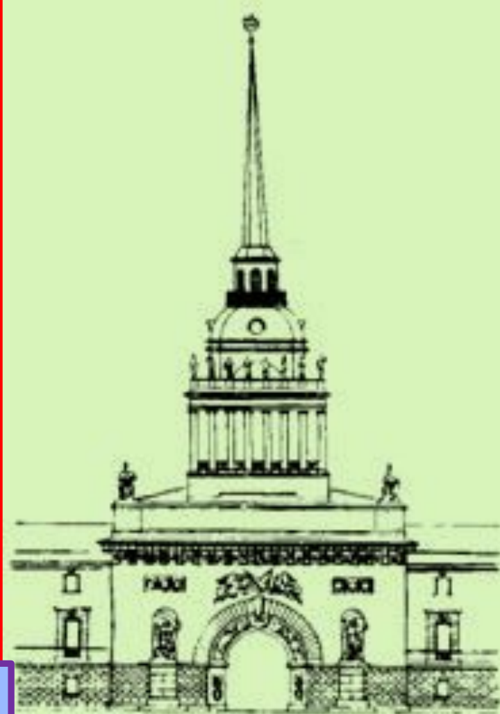
Санкт - Петербург. Башня Адмиралтейства 1806 г.