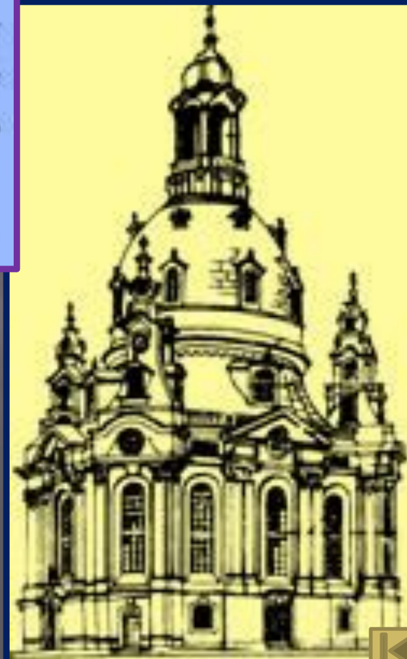
Церковь Сант - Иво в Риме 1669 г.